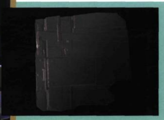
Modèle 3D d'une serrure d'époque obtenu à l'aide d'un scanneur laser 3D.