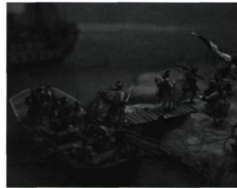
Débarquement des troupes au fort Niagara, maquette du Musée national de la marine, Paris

À l'occasion du 250 e anniversaire de la bataille des plaines d'Abraham, le Musée de la civilisation présente, jusqu'au 14 mars 2010, « 1756-1763, récit d'une guerre ». Prenant la forme d'un parcours chronologique sur fond de relations commerciales entre l'Europe et les colonies britanniques et françaises, cette exposition replace l'événement marquant du 13 septembre 1759 dans le contexte de la guerre de Sept Ans. Au gré d'artéfacts du quotidien, de lettres et de plans signés par de grands acteurs de l'affrontement, comme les généraux Wolfe et Montcalm ou le colonel James Murray, on y aborde des faits importants de ce premier conflit à ramifications mondiales, mais aussi la dimension humaine de la guerre à travers la parole de ceux qui l'ont subie. Québec. Info : 418 643-2158 ou www.mcq.org