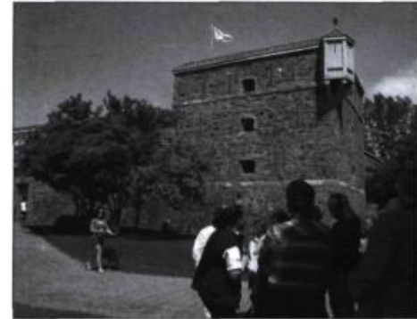
Visite au fort de Chambly