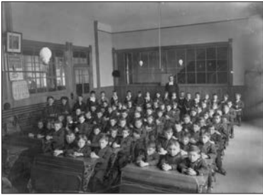
Classe de l'école Saint-Paul-de-Viauville, 1911