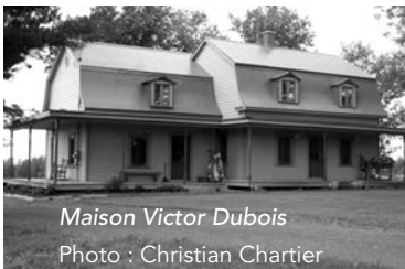
Maison Victor Dubois