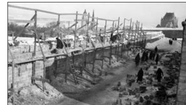
Chômeurs restaurant la Citadelle en 1933

La première exposition virtuelle du Musée Royal 22 e Régiment, « Forteresse : histoire d'une citadelle et de ses habitants », est accessible à l'adresse www.laforteresse.ca . Au gré de cinq sections consacrées au Régime français, au Régime anglais, à la période canadienne, au Royal 22 e régiment et à la Citadelle aujourd'hui, on découvre l'histoire de cette forteresse et de ses habitants, qui ont marqué la ville de Québec, le pays et la scène internationale depuis 200 ans. Des faits moins connus sont aussi révélés; on apprend entre autres que la Citadelle a abrité des chômeurs pendant la Crise économique.