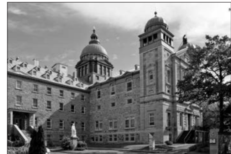
Ensemble conventuel de la Congrégation des Sœurs de Sainte-Anne