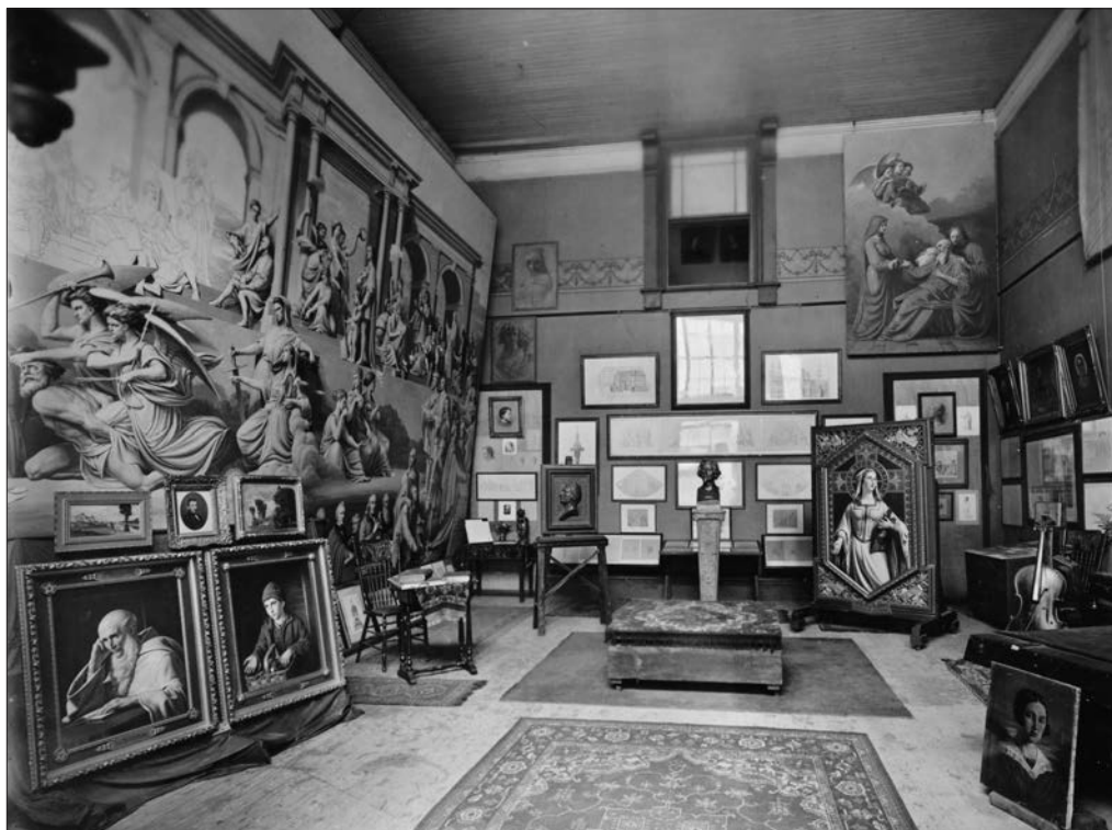
Exposition posthume organisée par Augustine Bourassa des œuvres de son père dans son atelier de la rue Sainte-Julie, à Montréal. Vue vers l'est. Photo du studio Notman, Montréal, été 1917. Épreuve à la gélatine argentique, 19,5 x 24,7 cm.

Source : MNBAQ, fonds Anne-Bourassa, K7097. Don en 1978