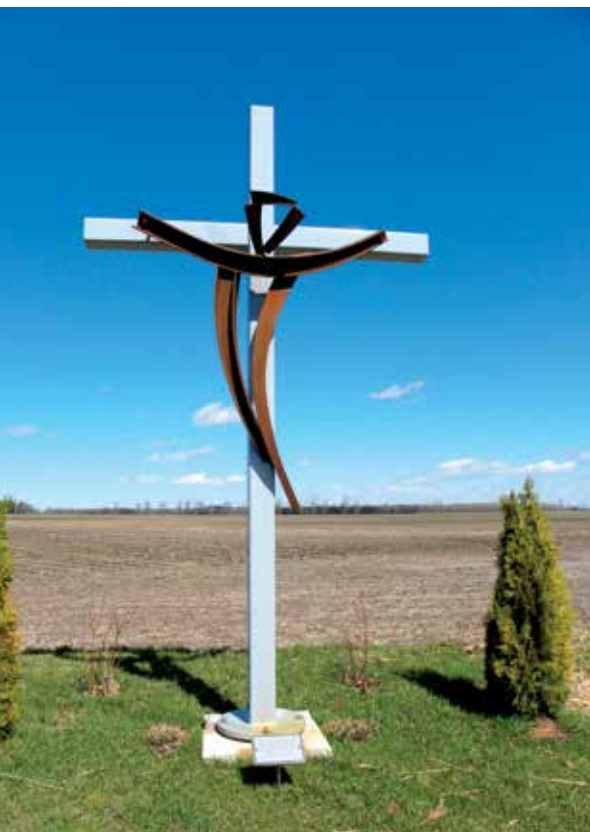
Cette croix qui se dresse à une intersection a été commandée à l'occasion du 100 e anniversaire de Saint-Bernard-de-Michaudville, en Montérégie, en 2008.