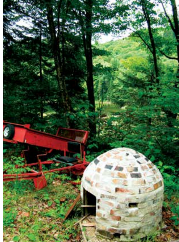
Dans ce four miniature déplaçable d'une hauteur de 90 cm, la carbonisation du bois nécessite une journée, alors qu'elle en prend une quinzaine dans les fours plus grands.

Les Première et Deuxième Guerres mondiales ont provoqué l'augmentation de la demande de charbon. Plus de 140 fours ont été construits au Québec de 1914 à 1923. Dans la région de Portneuf, ils se sont multipliés surtout vers les années 1940, alors que la demande en charbon est passée de 50 000 à 100 000 tonnes par an au Québec.