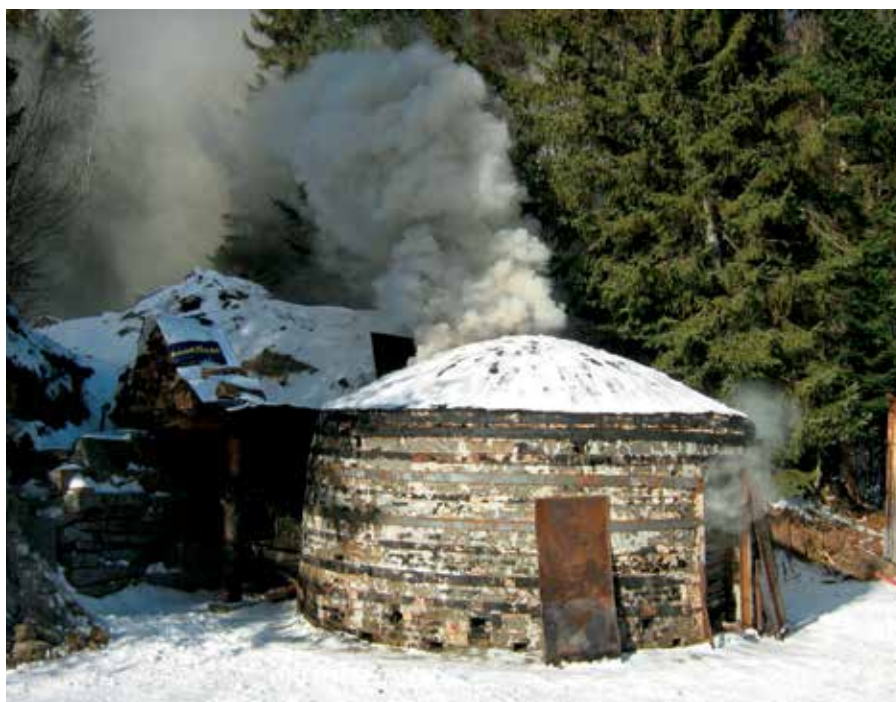
Quelques passionnés produisent encore aujourd'hui du charbon de bois dans des fours traditionnels.