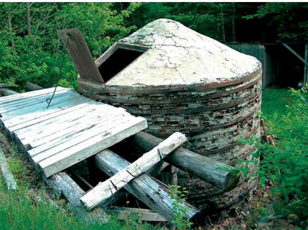
Les charbonniers se servent entre autres de la porte du haut et de la passerelle pour finir de remplir le four.

Après la guerre, elle a diminué et l'exportation a cessé. C'est toutefois dans les années 1990 que la production a dégringolé pour ne plus remonter. Les revenus provenant de la production artisanale de charbon de bois, équivalant à un travail au salaire minimum, ne justifiaient plus la peine encourue. De plus, de nouvelles réglementations environnementales sont venues limiter l'utilisation des fours. Seules les entreprises détiennent aujourd'hui assez de capitaux pour investir dans des installations antipollution tout en restant rentables. C'est le cas de Charbon de bois Feuille d'érable, qui produit du charbon de bois de manière industrielle, à Sainte-Christine-d'Auvergne.