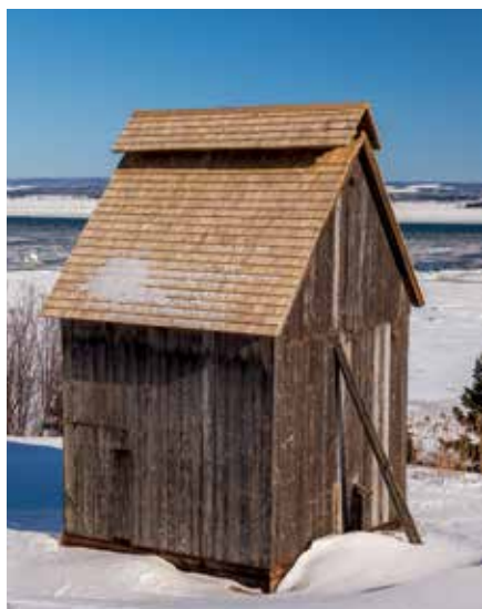
Fumoir de Martine Vally après sa restauration