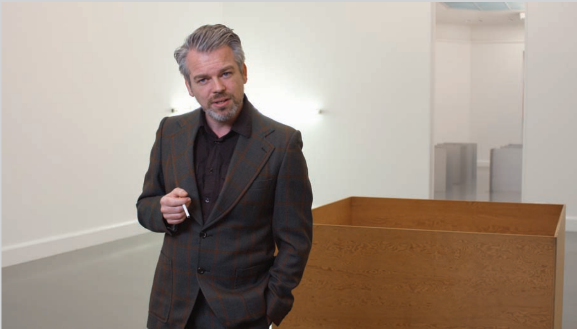
Gerard Byrne, A Thing is a Hole in a Thing it is Not , 2010, installation vidéo HD / HD video installation, présentée dans l'exposition inaugurale, Histoires de l'art , novembre 2011 / presented in the inaugural exhibition Art Histories , November 2011.

in joint projects with some of them, and even to reconstruct significant actions or exhibitions that they have produced; in fact, this is something that we are currently attempting to do.