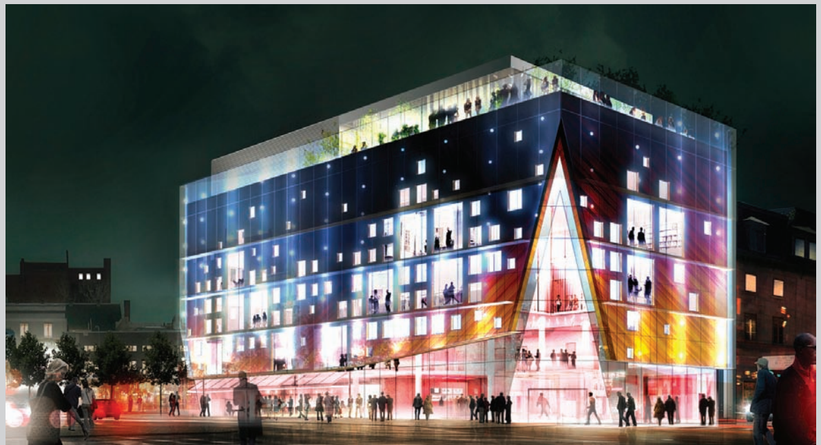
Aedifica + Gilles Huot Architectes, maquette de l'édifice du 2-22, mars 2010 / Model of the 2-22 Building, March 2010.

M-J J : Le parti pris à VOX est de dépasser les limites disciplinaires de l'art et, de manière plus affirmée je l'espère dans l'avenir, ses catégorisations historiques. Nous considérons l'image d'un point de vue post-média, à savoir qu'il s'agit avant tout d'un phénomène – esthétique, technologique, social, historique, etc. – à l'intersection de plusieurs médiums. Un phénomène également qui ne peut être