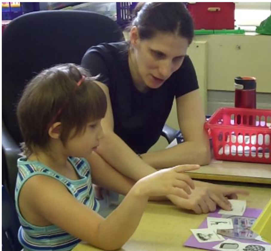
Phrases construites avec des pictogrammes à partir de la photographie