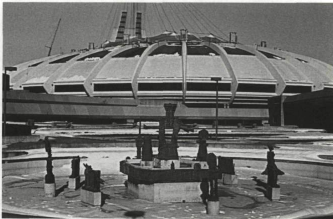
Jean-Paul Riopelle, La Joute . Stade olympique, Montréal.

Cette symbolique renvoie en général à des conditions humanistes représentant les valeurs fondamentales de la destinée de l'Homme, indépendamment de toute considération factuelle, alors qu'au siècle dernier, ces valeurs étaient incarnées à travers la