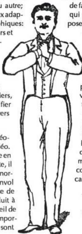
Gladness. L'un des modèles d'attitudes proposé par Henry Davenport Northrop dans son livre The Peerless Reciter or Popular Program , 1894.

Danser dans les espaces publics constitue toujours une alternative valable. Mais les comportements jugés acceptables en public ne sont-ils pas infimes? La danse est certainement parmi ceux qu'on s'attend le moins à trouver dans un aéroport, un centre commercial ou le hall d'une institution bancaire. De même, on a besoin de permis pour