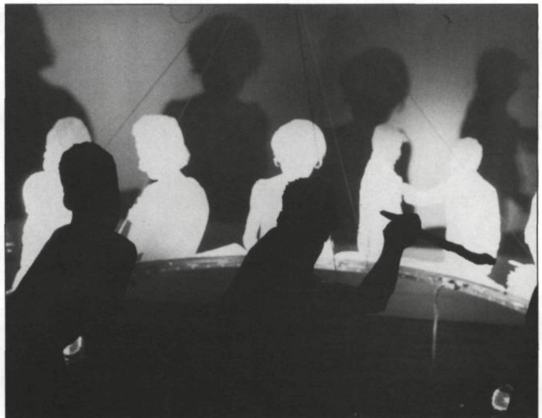
→ Guy Bourassa, Descriptions de descriptions , 1989.

Tôle galvanisée, six lampes halogènes, câble d'acier, transformateur. 175 x 60 cm.