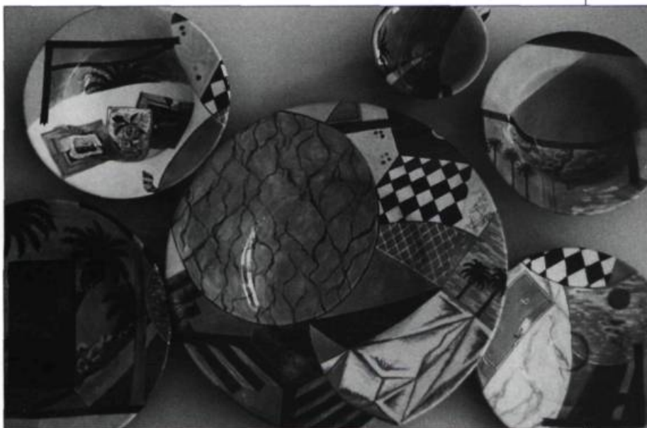
Paul Mathieu, The First Summer of Love, 1992.(assemblé/stacked). Porcelaine/Porcelain. 45 x 45 x 20 cm.