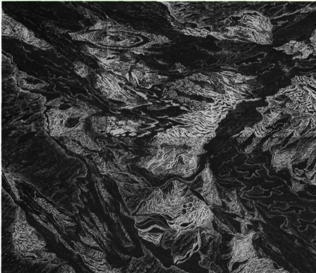
René Derouin, Suite nordique , 1979. Gravure sur bois en 6 éléments, 10/20. 221 x 232 cm. Collection Musée d'art contemporain de Montréal.