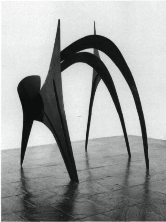
Alexander Calder, The Arches, 1959. 269,2 x 273,1 x 221 cm. Collection Whitney Museum of American Art, New York.

hétérogénéité, faisant constamment se rencontrer l'abstraction et la figure, le mécanique et l'organique, le lourd et le léger, le solide et l'aérien.