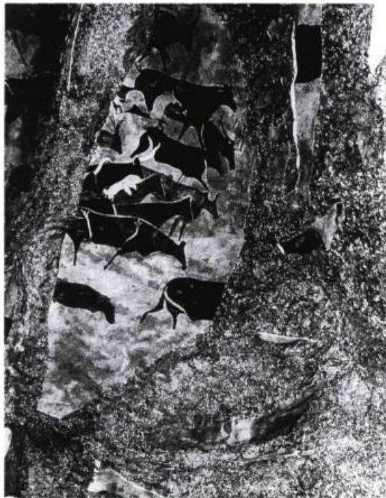
Diane Laurier, L'esprit du temps, 1994. Détail de l'installation. Galerie d'art Lionel-Groulx.