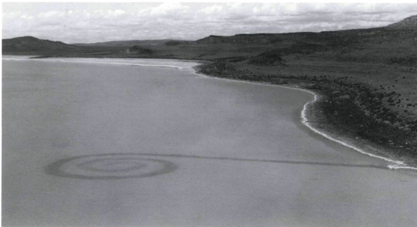
Robert Smithson, Spiral Jetty , 1970. Rozel Point, Great Salt Lake, Utah.