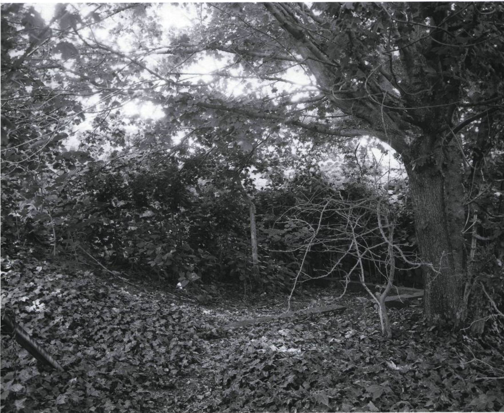
Robert Smithson, Partially Buried Woodshed , 1970. Kent State University, Ohio. Photo : Mark Ruwedel, 1994. Courtoisie de la Galerie Art 45, Montréal.