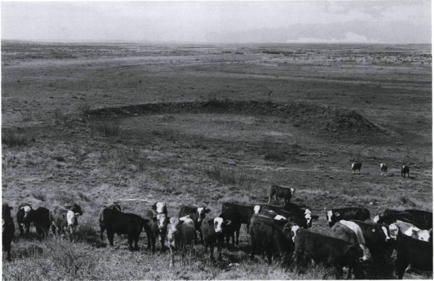
Robert Smithson, Amarillo Ramp , 1973. Tecovas Lake, Texas. Photo : Mark Ruwedel, 1994. Courtoisie de la Galerie Art 45, Montréal.