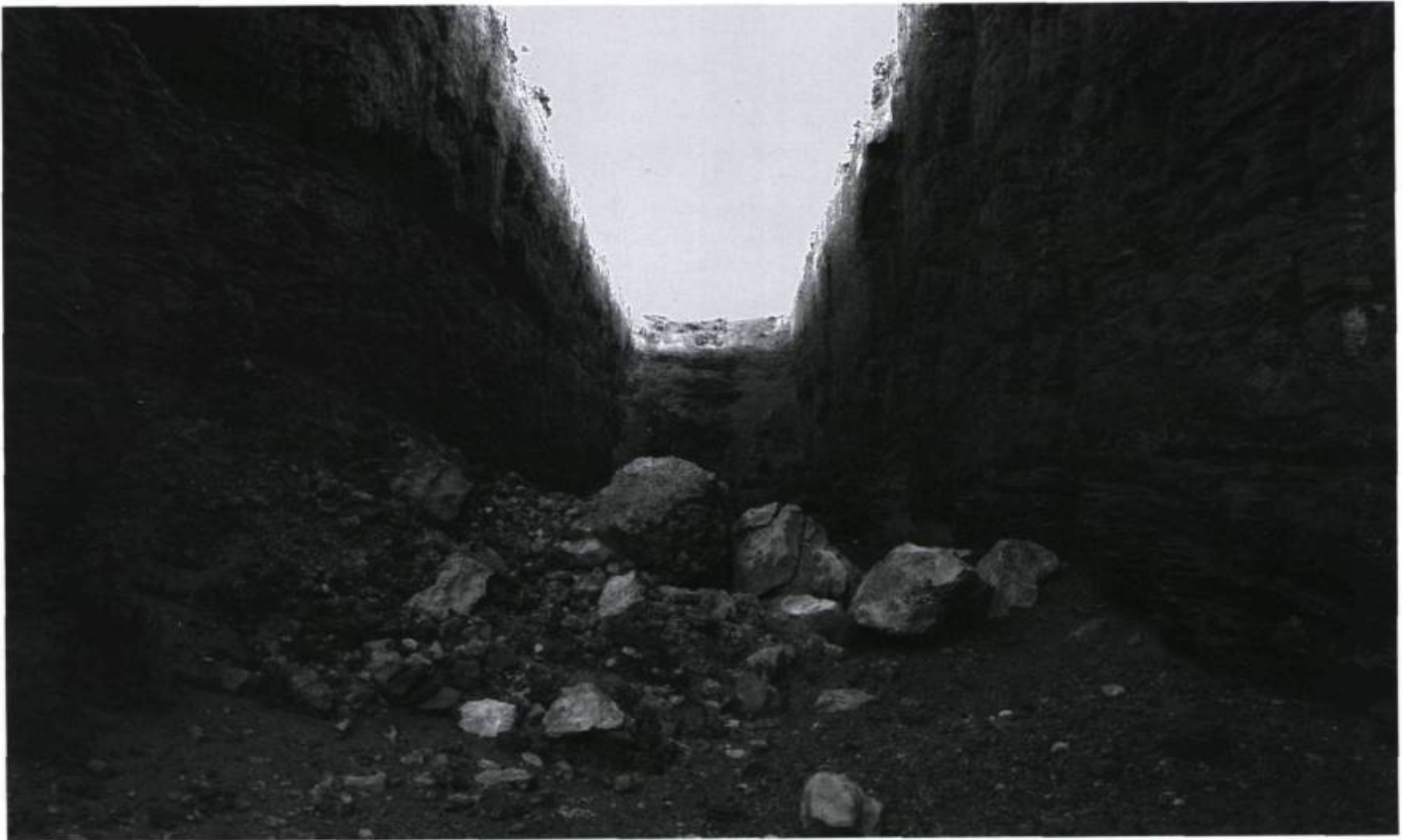
Michael Heizer, Double Negative , 1969-70. Mormon Mesa, Nevada.