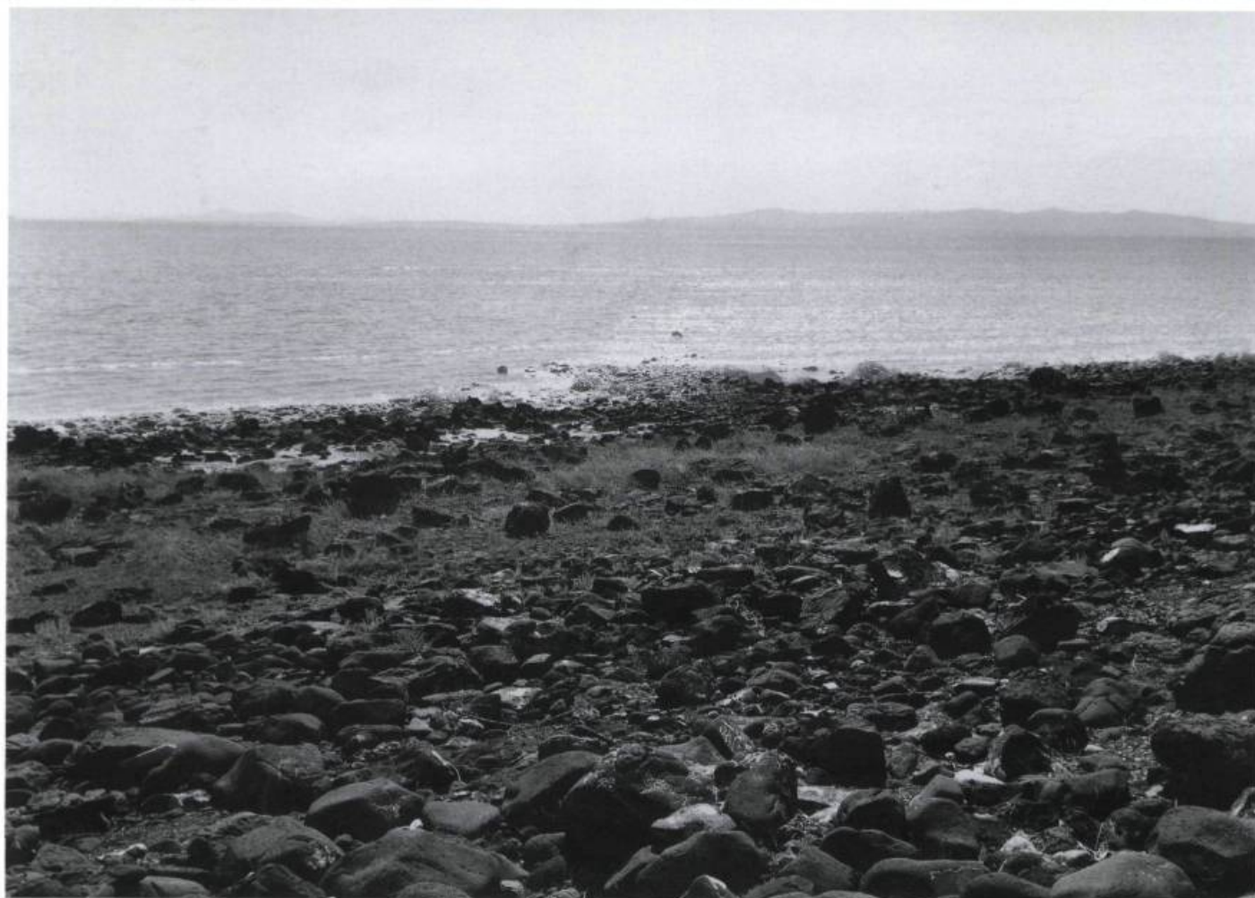
Robert Smithson, Spiral Jetty , 1970.