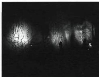
Gilles Morissette, Zone d'énergie , 1995. Détail de l'installation. Centre Expression, Saint-Hyacinthe, printemps 1995.