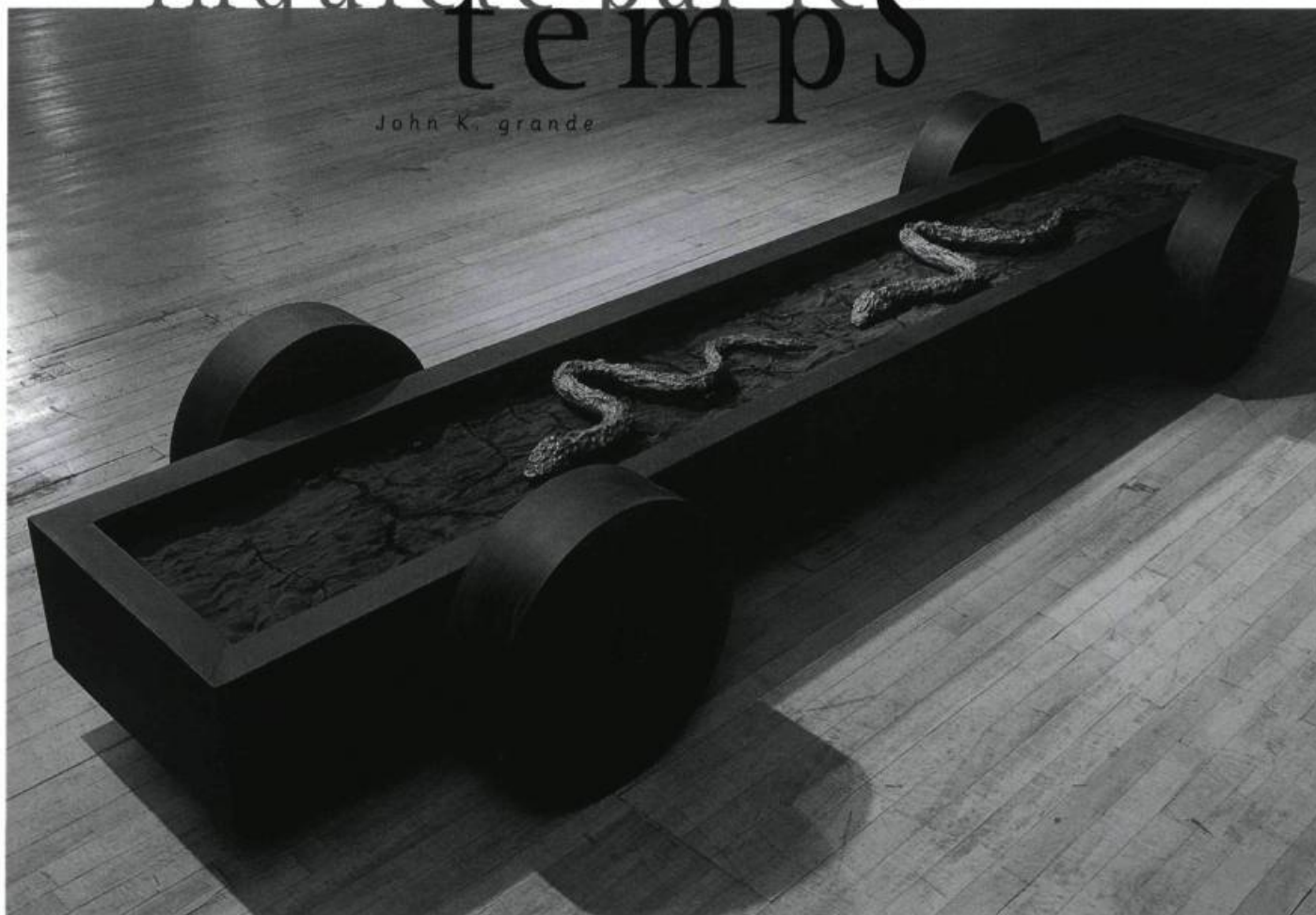
Yves Louis-Seize, Transporter avec soi un peu de cette terre éruptive , 1997. Acier, argile, corde, pigments / Steel, clay, pigments. 50 x 300 x 80 cm.

La plus récente installation de Yves Louis-Seize s'inscrit dans le prolongement des précédentes expositions, notamment Passage... à l'Autre rive qui s'est tenue en 1988 au Centre d'exposition Expression, à Saint-Hyacinthe. On y reconnaît d'emblée les mêmes structures imposantes en acier aux contours anguleux, géométriques ou incurvés, se découpant dans l'espace de la galerie. Les cinq pièces de l'exposition pourraient sans doute constituer une série, telles des bornes le long d'une route ponctuant un voyage... intérieur. Le vocabulaire formel de Louis-Seize est archétypal et évoque des stéréotypes symboliques issus de notre inconscient collectif et ce, d'autant que les matériaux sont traités de manière générique et anonyme.