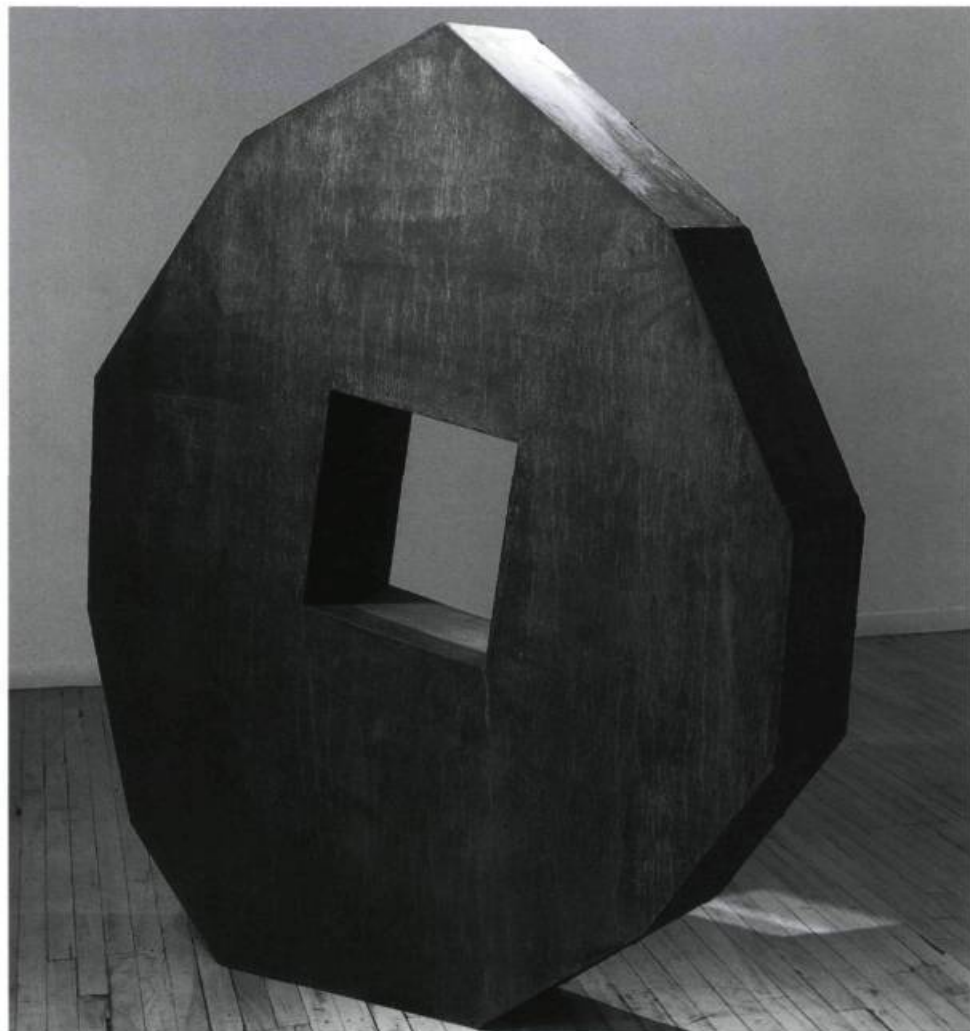
Yves Louis-Seize, Le surgissement de l'indifférence , 1997. Acier/Steel. 175 x 157 x 25 cm.

Yves Louis-Seize, l'homme inquieté par le temps Centre d'exposition CIRCA, Montréal 18 octobre - 15 novembre 1997