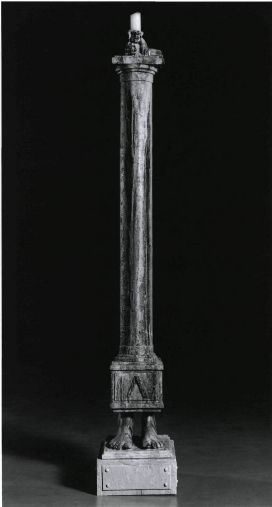
Normand Moffat, Je vous aimais , 1993. Acrylique, bois, ultracal. 200 x 30 x 45 cm.