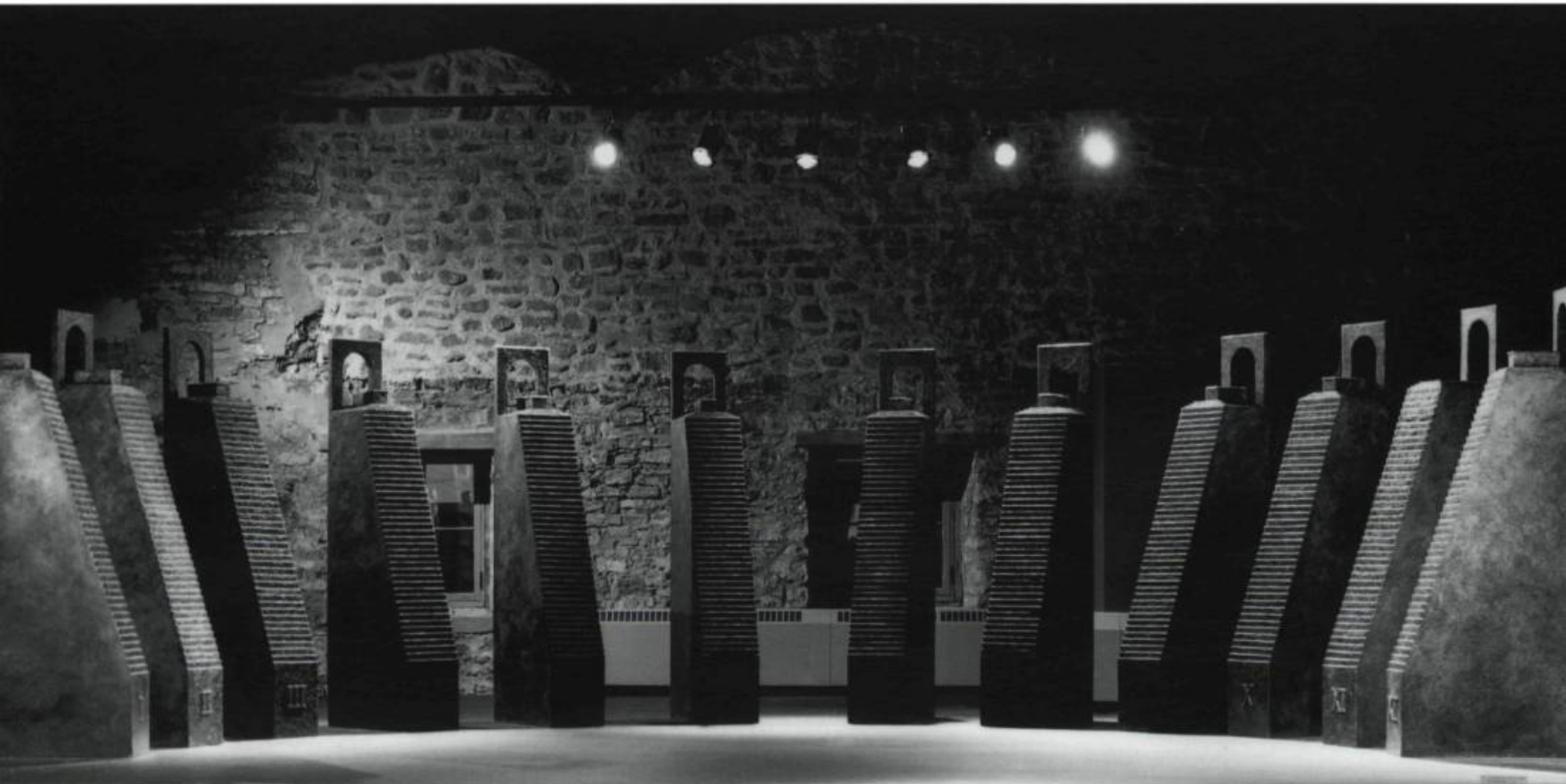
Normand Moffat, L'envers des frontières, 1989. Acrylique, bois. 240 x 840 x 480 cm.

généralement peu considérés dans l'élaboration d'un portrait, mais auxquels il accorde une grande richesse symbolique : les mains qui donnent, qui reçoivent, qui consolent, mais aussi qui expriment et qui font naître l'image ; les pieds qui portent, qui mènent ailleurs. Ces mains et ces pieds moulés disent à la fois l'absence et la présence de ceux dont il veut célébrer la mémoire. « Ici créer, (...) c'est réparer l'objet aimé, détruit et perdu (ou que l'on sait irrémédiablement perdu), le restaurer comme objet symbolique, symbolisant et symbolisé, assuré d'une certaine permanence à côté de soi. C'est en le réparant, se réparer soi-même de la perte, du deuil, du chagrin » 6 .