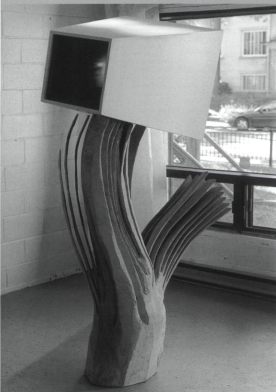
Gilles Bissonnet, Split I , 1999. Érable rouge, contreplaqué, chambre claire. 126 x 88 x 212 cm.

O n peut aborder la démarche de Gilles Bissonnet sous divers angles. Son exposition nous révèle plusieurs voies d'explorations formelles, considérations sociétales et filiations conceptuelles concernant les grands thèmes liés à la place de la sculpture contemporaine, son rapport à l'histoire et surtout sa pertinence dynamique dans le