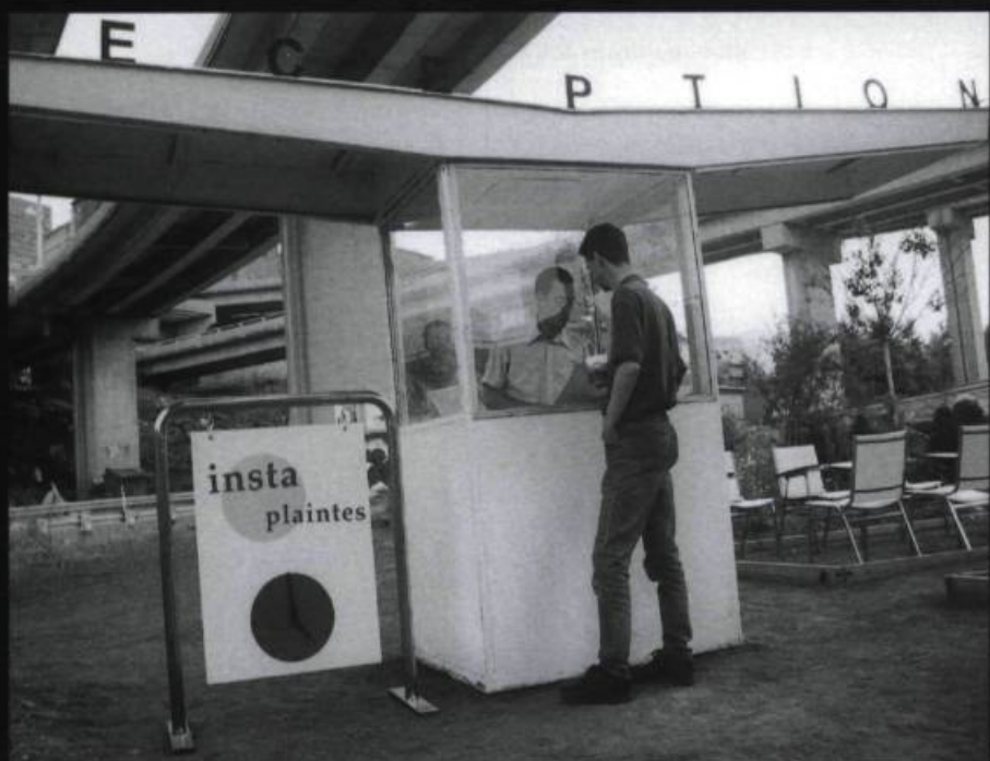
Vue générale d'Émergence 2000, produit par le groupe communautaire l'îlot Fleurie (Québec).