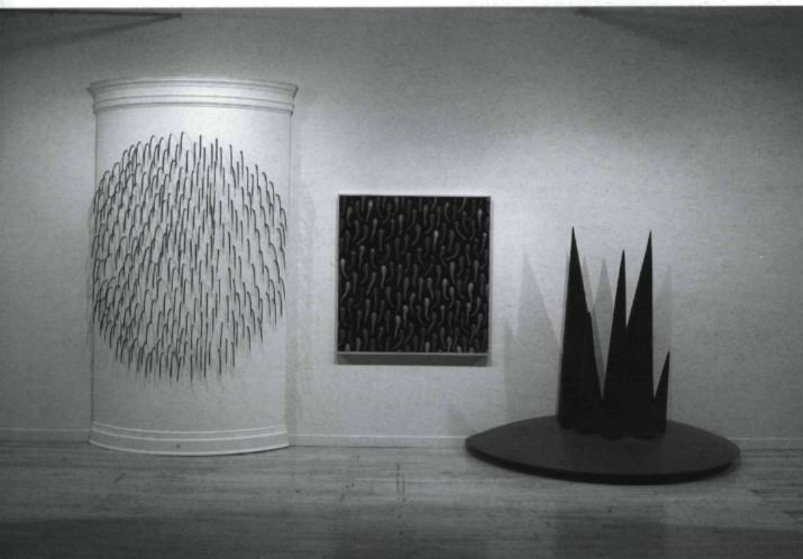
DENIS ROUSSEAU, Synapses et autres phénomènes , 2002. Cils , détail. Bois, résine de coulage, peinture à l'huile et alkyde, caoutchouc, électroaimant, circuit électronique. 2,5 x 1 x 5 m.