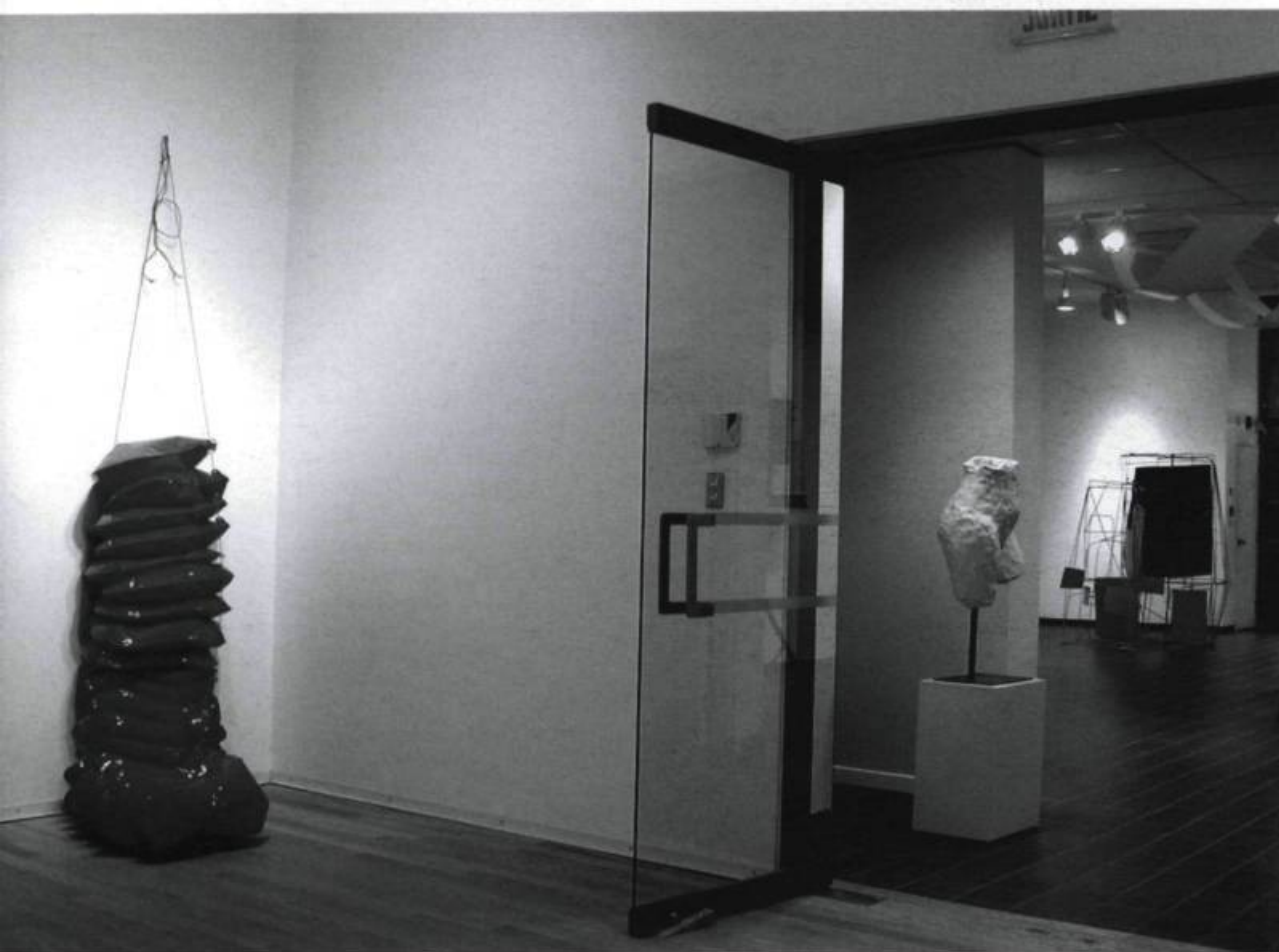
JEAN NOËL, La mécanique des fluides , 2002. Vue partielle de l'exposition. Musée d'art de Joliette. Photo : Jean Noël.