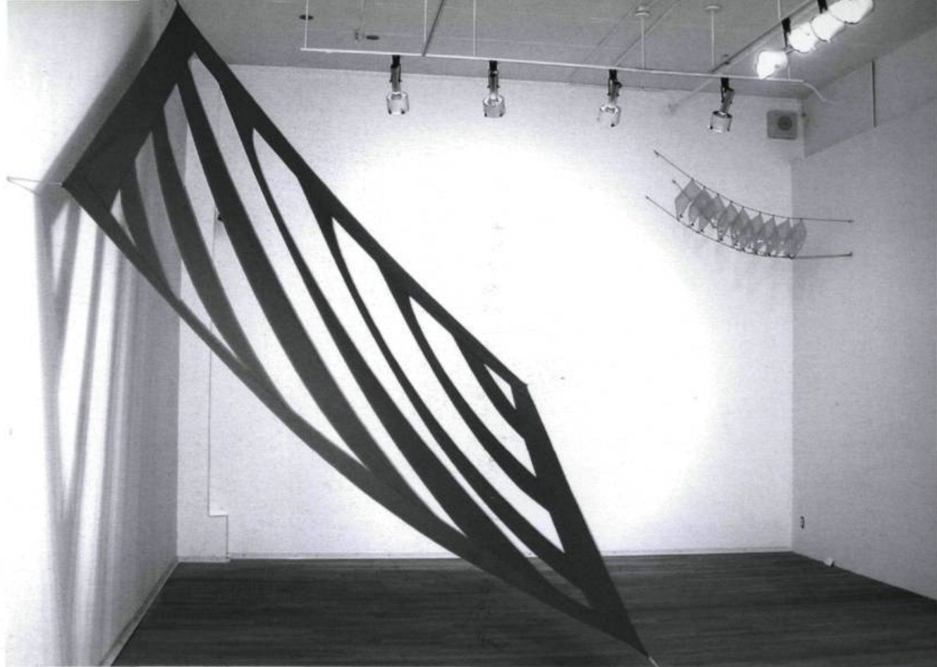
DENIS ROUSSEAU, Synapses et autres phénomènes , 2002. Tiars , détail. Photographie à jet d'encre, bois, fibre de verre, résine de coulage, peinture alkyde. Env. 3 x 5 x 6 m.