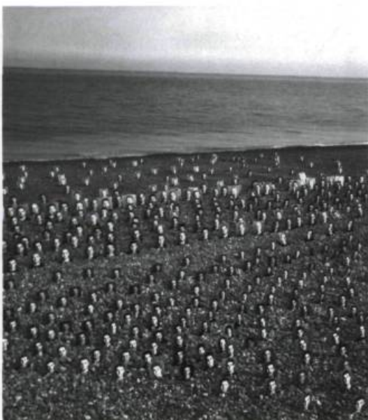
BERTRAND CARRIÈRE, Jubilee , 2002. Installation.

commun. C'est que, de toute évidence, la mémoire personnelle est ancrée dans la mémoire collective. Aussitôt que l'exposition s'est mise en place, chacun pouvait lire ces images dans l'horizon de sens qu'apporte l'histoire. C'est ainsi que les citoyens jeunes et vieux et les touristes de passage ont pu apprécier cette mise en exposition de portraits évoquant la présence de ceux qui ne sont plus. En tout cas, la presse locale l'a à sa manière récupérée. Mais c'était sans doute l'un des buts du jeu. Afin de combattre l'oubli malheureux, celui que l'on nomme le « mauvais oubli », il est souhaitable que la mémoire du monde admette la folie des