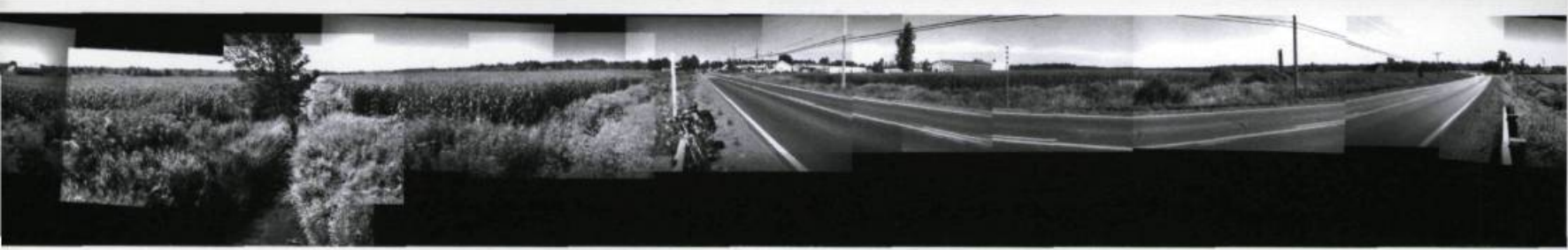
JULIE LAPALME, Tapis à langues , 2002. LA-6 [N45°27'48" O-72°43'14"] Détail du site Web autour du ruisseau Lapalme.

corps allongé est projetée la vidéo d'une femme nue qui s'enfonce dans la graisse comme dans l'eau du bain pourtant inexistante. Si le visiteur laisse passer le temps, il verra ce corps adipeux suinter. Des gouttelettes perlent et glissent sur la surface de graisse. Il ne faut pas se méprendre, ce corps ne fond pas sous l'effet de la chaleur ambiante, mais bien parce qu'une communauté virtuelle, invisible dans le lieu où le corps est exposé, participe à sa disparition.