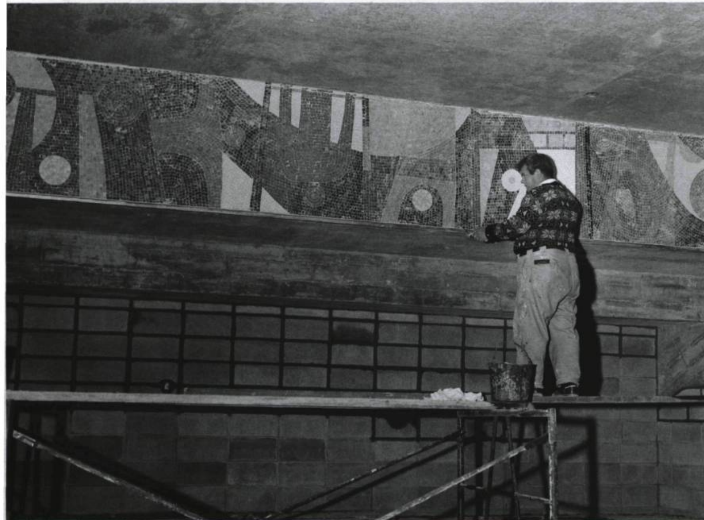
MARIO MEROLA, Les sports , 1960. Détail. Mosaïque de verre. Aréna Maurice- Richard.

demeure le seul témoin en arts visuels des Jeux olympiques.