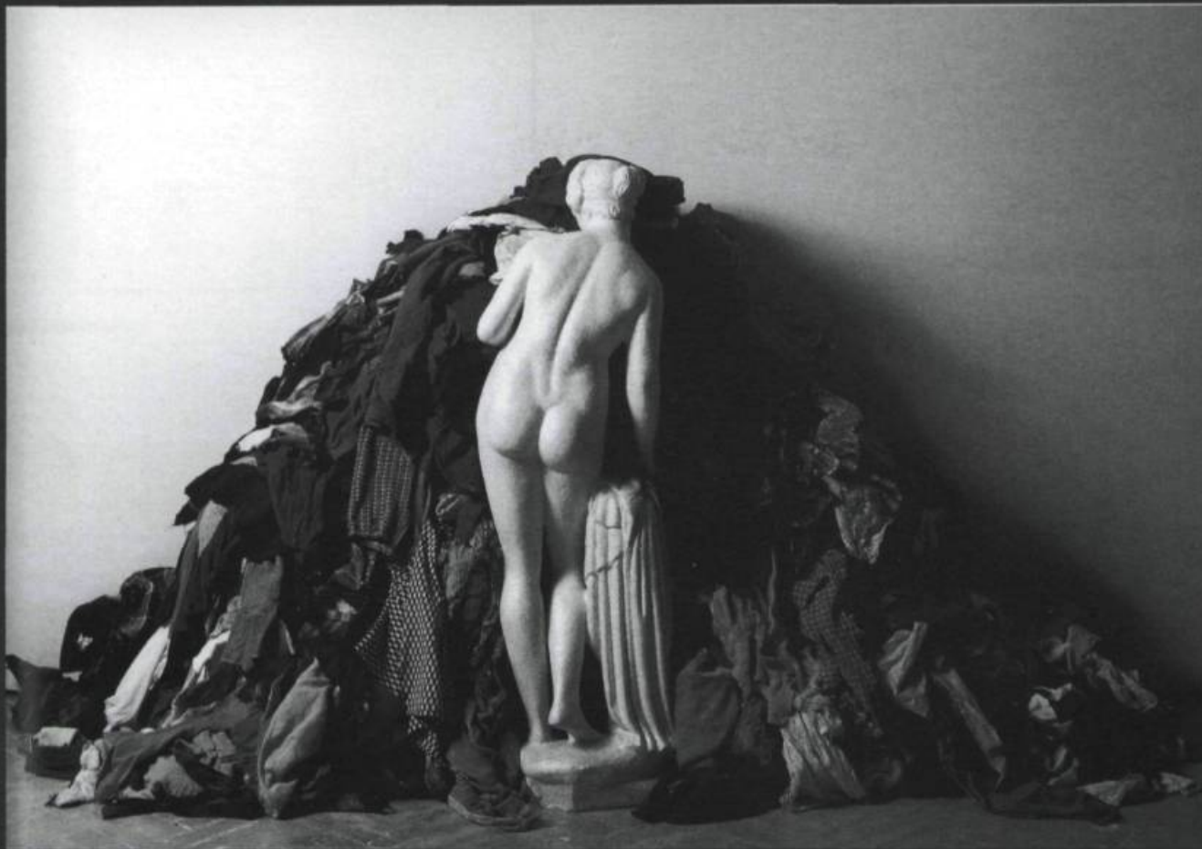
MICHELANGELO PISTOLETTO, Vénus des chiffons , 1967. Ciment, mica, chiffons. 160 x 130 x 130 cm. Biella (Italie), collection de la Fondazione Pistoletto.