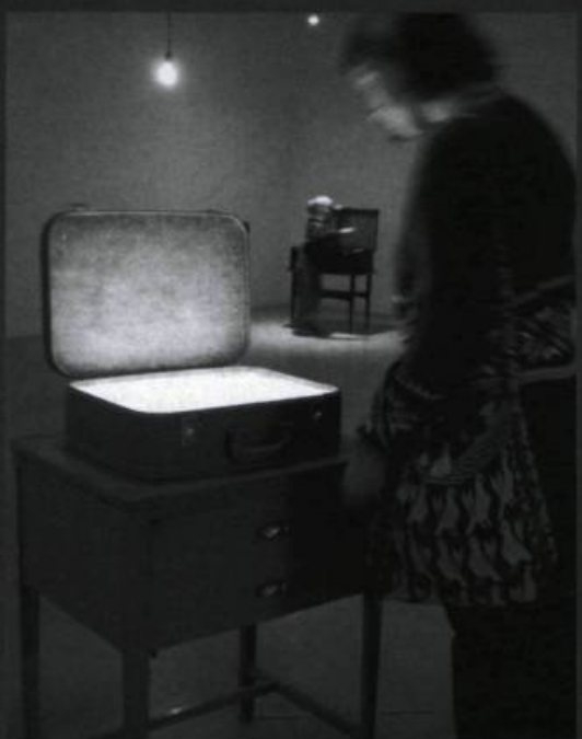
INGRID BACHMANN, Le sublime portatif , 2003. Détail.