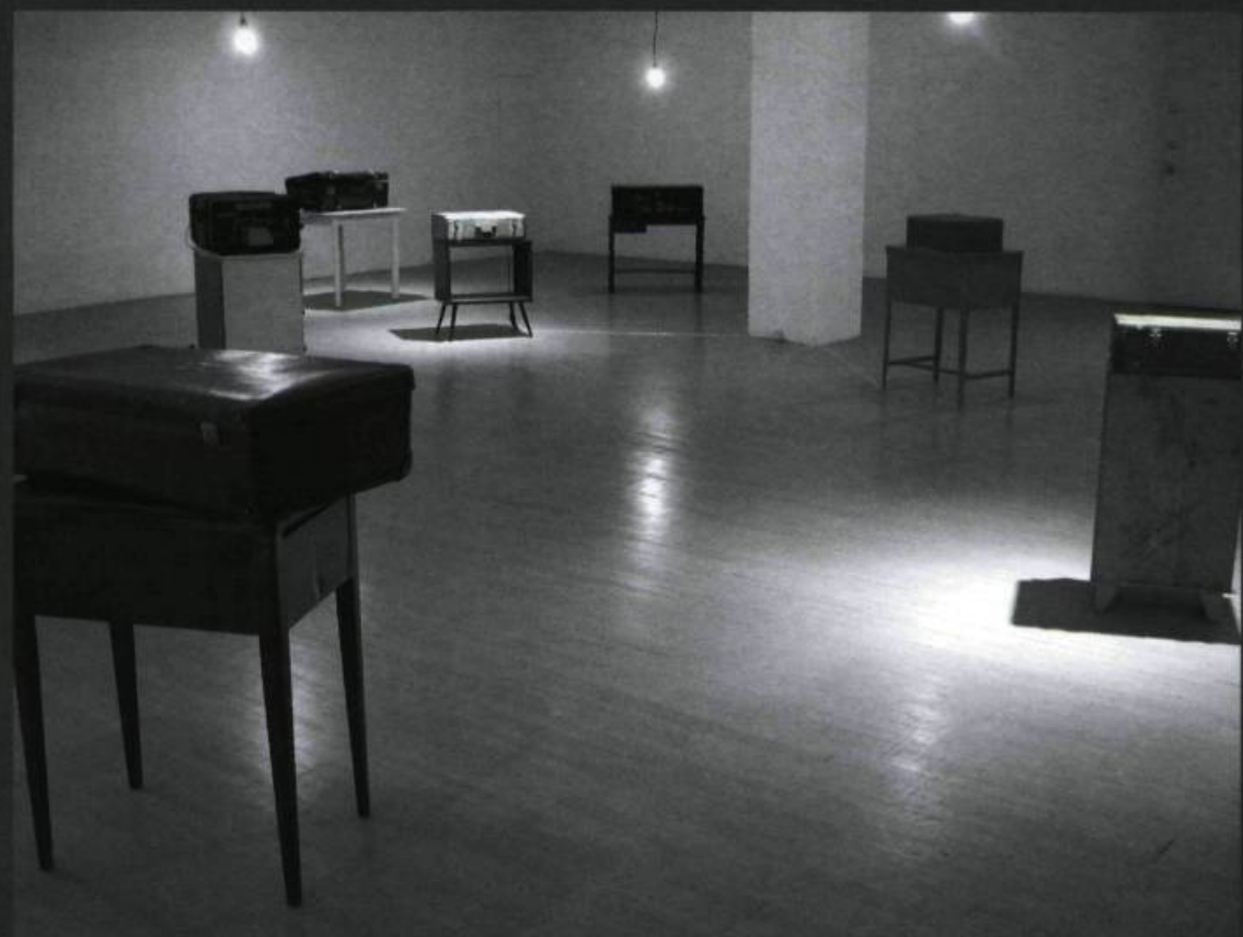
INGRID BACHMANN, Le sublime portatif , 2003. Vue générale.