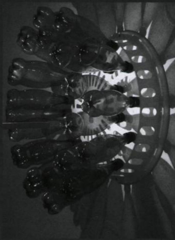
DIANE LANDRY, Le déclin bleu , 2003. Détails : Mandala Perrier . Moteur, objets choisis, aluminium, bois, éclairage halogène. Objet au mur : 100 X 100 X 50 cm ; projection au mur (variable) : environ 7 X 4 m. Projet réalisé dans le cadre d'un échange entre La chambre blanche (Québec) et le centre Cyprès (Marseille). © Sodart. Photo : D. Landry.