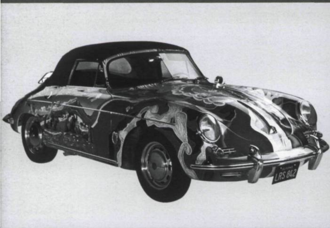
Porsche de Janis Joplin peinte par Dave Richards vers 1968.