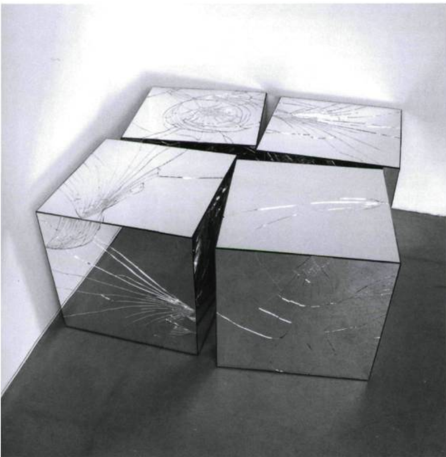
Jeppé HEIN, Broken Mirror Cubes, 2005. Bois, miroir, silicone. 4 cubes : 50 x 50 x 50 cm /ch. Avec l'aimable autorisation de Johann König, Berlin et 303 Gallery, New York. Photo : Claus Rasmussen.

réfère Hein. En témoignent les quatre Broken Mirrored Cubes (2005), car si les fêlures rendent au diaphane et défectif dispositif de Morris son opacité objectale, c'est aussitôt pour remiser ces délicats objets fracassés dans le recoin de la galerie. Pire encore serait le Burning Cube (2005) vouant à la consommation un cube minimaliste. Un cas limite alors fut atteint lors de l'investissement par l'artiste de l'espace 315 du Centre Pompidou (2005). Son intervention