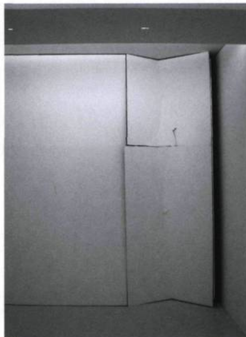
Jeppé HEIN, Self-Destructing Wall, 2003. Contreplaqué, moteur, construction de métal, peinture. Dimensions variables. Avec l'aimable autorisation de Johann König, Berlin et 303 Gallery, New York. Photo : Carla Orthen.

Si donc Morris pouvait jadis écrire que s'il n'était pas devenu moins important en soi, l'objet artistique ne pouvait seul suffire, l'attitude de Hein se voudrait plus inexorable encore. Prolongeant ce questionnement en jouant sur la nature défective ou déceptive du miroir, voire constatant