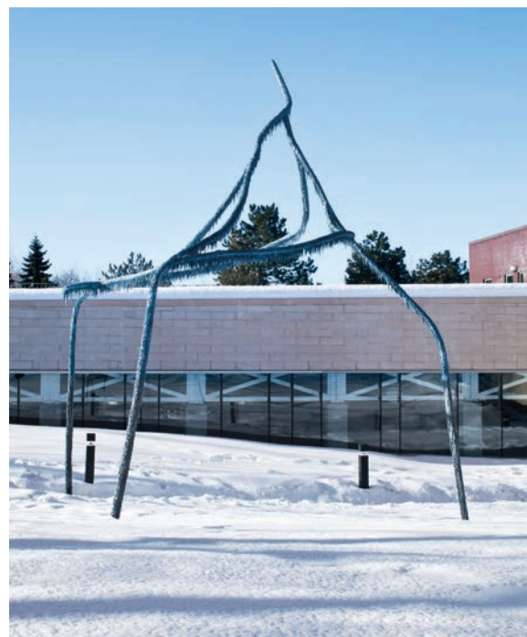
Patrick COUTU, Source , 2011. Bronze. H.: 5,4 m. Centre sportif de Notre-Dame-de-Grâce, Parc Benny. Bureau d'art public de la ville de Montréal.