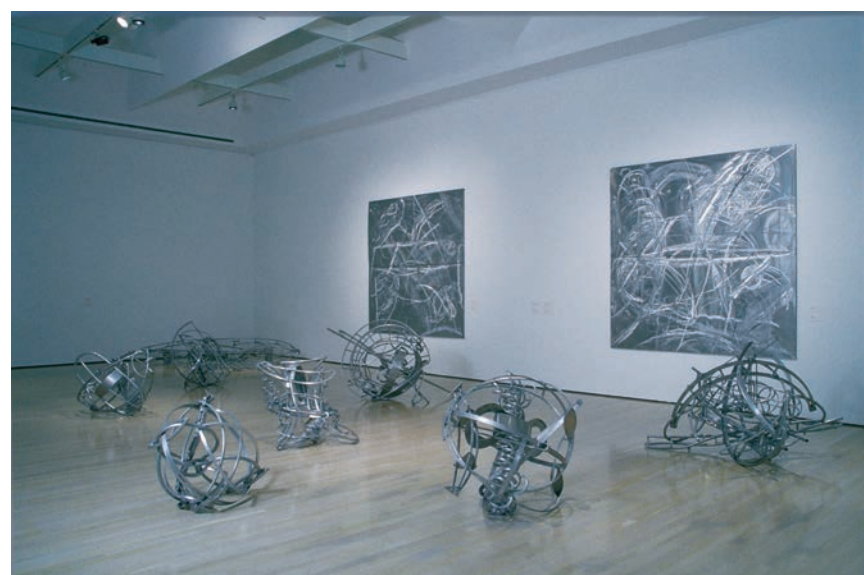
Henry Saxe : œuvres 1960 à 1993 . Vue de l'exposition/Exhibition view. Musée d'art contemporain de Montréal, 20 mai - 25 septembre 1994 / May 20 - September 25, 1994.