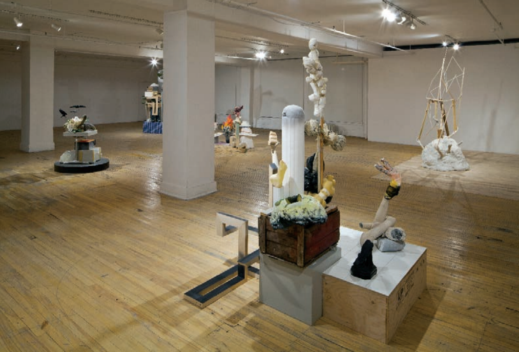
Éric CARDINAL, Un moment précis . Centre d'exposition CIRCA, 2012.