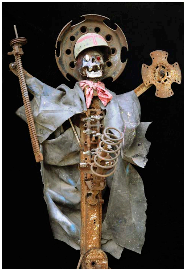
André Eugène, Military Glory , 2010. Métal, pneus, crâne, tissu et objets trouvés/ Metal, tires, skull, fabric and found objects, 182 cm (H).

individu empreint de craintes et d'angoisses, semblable donc à tous les hommes, avec une particularité essentielle : il est détenteur d'un secret, d'une richesse perdue par l'homme occidental. En ce sens, il est considéré comme plus éclairé. Breton lui prête une aptitude à répondre aux questions fondamentales que l'homme se pose. Pour lui, ces sociétés qui avaient échappé à la contamination du christianisme et du rationalisme offraient le spectacle de l'homme qu'il appelait de ses vœux, vivant en harmonie avec la nature, dans une union spirituelle avec les éléments. Ces peuples témoignent de la possibilité d'une autre vie. Breton aspirait à recréer ces modes d'expérience et à retrouver ces pouvoirs perdus. C'est d'ailleurs ce qu'il écrit, en 1936, à l'occasion de l' Exposition surréaliste d'objets . Il y distingue nettement les objets qu'il appelle objets-dieux de tous les objets trouvés, modifiés et perturbés, présentés dans cette exposition: objets-dieux, écrit-il, « dont nous jalousons très particulièrement le pouvoir créateur, que nous tenons pour dépositaires, en art, de la grâce que nous voudrions reconquérir 6 ». Récemment, en 2013-2014, le Centre Pompidou consacrait d'ailleurs une exposition au « Surréalisme et l'objet 7 », montrant ainsi la place essentielle donnée par les artistes à l'objet décontextualisé, transfiguré, transmué.