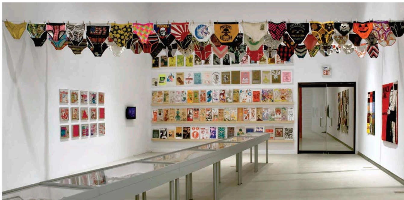
Will Munro, History, Glamour, Magic , Exhibition view/ Vue de l'exposition, Art Gallery of York University 2013.