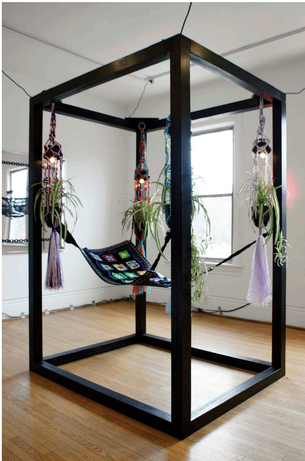
Will Munro , Spider Sex Sling , 2010. Wood, macramé, leather, acrylic, metal rings, electrical components and plants/Bois, macramé, cuir, acrylique, anneaux métalliques, pièces électriques et plantes, 213 x 152 x 122 cm.