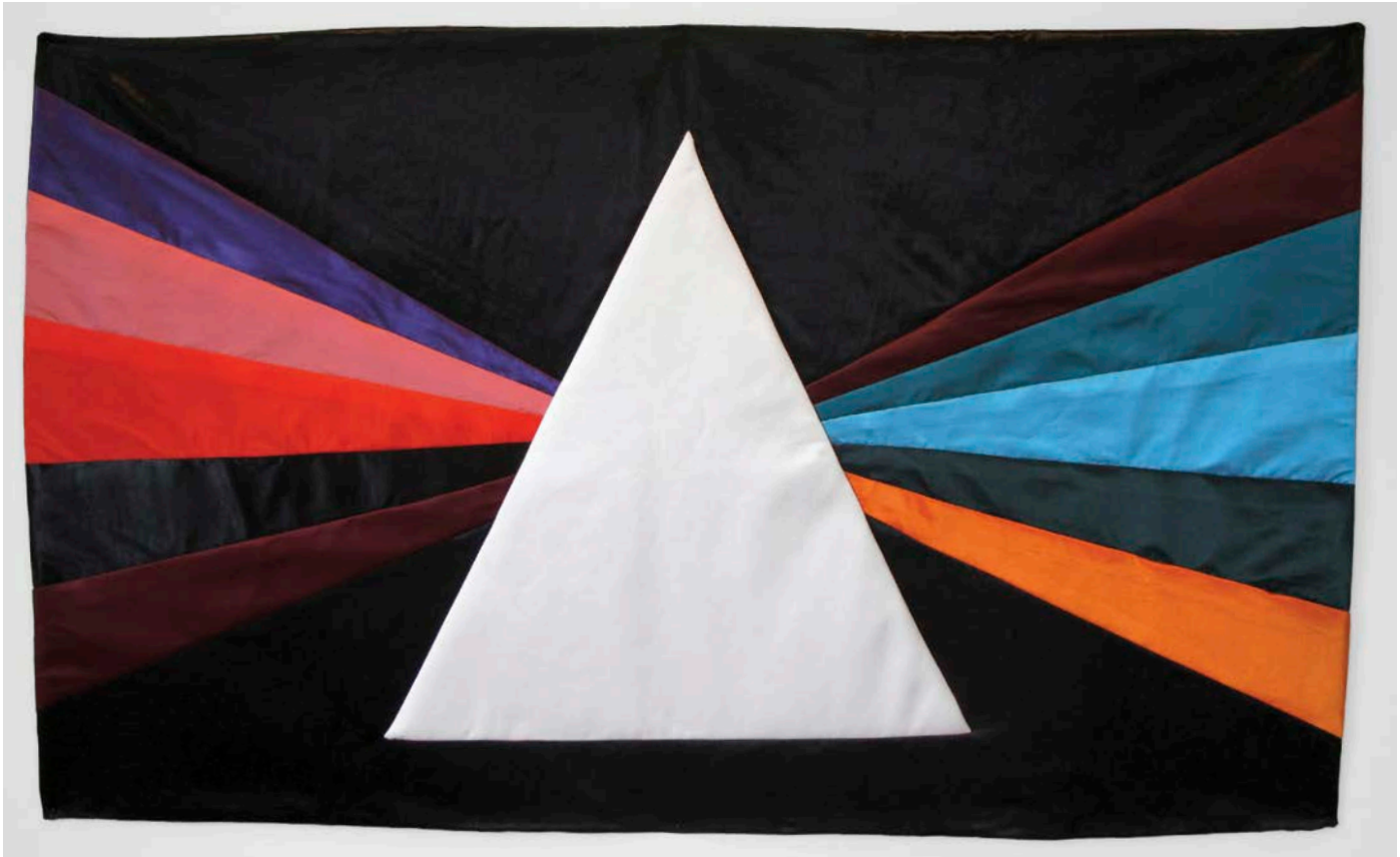
Will Munro, Infinity , 2010, stitched fabric/Tissu cousu, 86 x 147 cm.