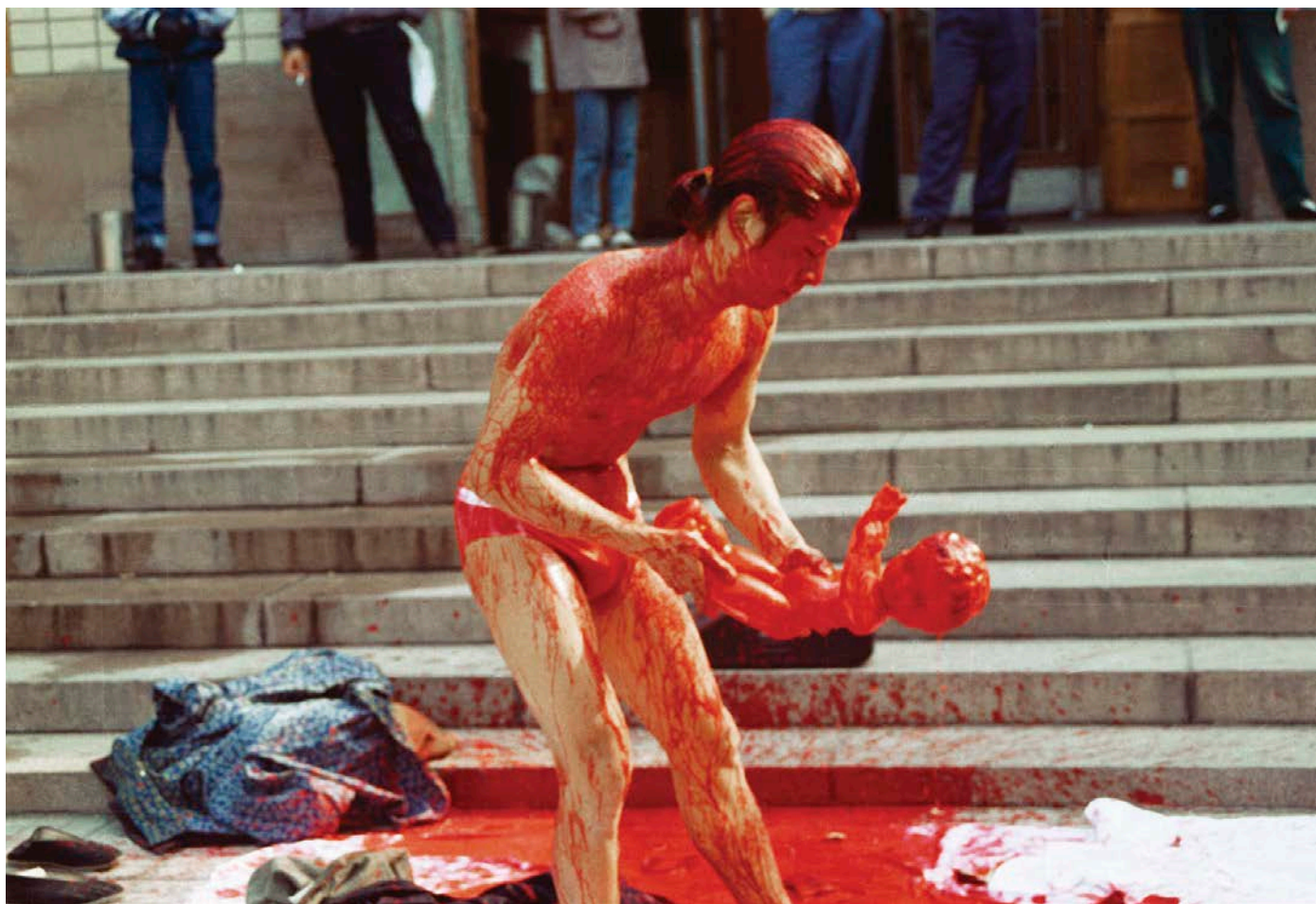
Zhang Huan, Angel , 1993. Performance, China National Art Gallery, Beijing.

Les premiers pas de l'artiste chinois Zhang Huan, dans la performance, sont caractérisés par une picturalité fortement marquée. Il reçoit un enseignement artistique traditionnel basé sur le dessin d'après modèle, et sa connaissance de l'art contemporain, notamment occidental, ne s'élargit qu'à son arrivée à Beijing au début des années 1990. Il choisit alors de faire de la performance son médium privilégié, et c'est couvert de peinture couleur de sang qu'il exécute sa première performance, Angel , en 1993. Les éclaboussures rouges maculent son corps, la poupée qu'il manipule et les marches de la prestigieuse Galerie nationale d'art de Chine de Beijing où il exécute son œuvre.