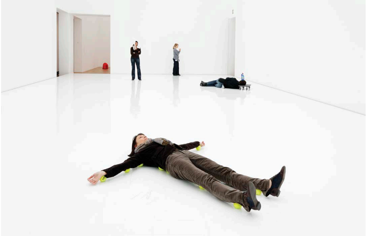
Erwin Wurm, One Minute Sculpture: Tennis Balls, 1998. © Erwin Wurm / SODRAC (2016) Photo : Studio Erwin Wurm / Kunstmuseum Bonn, Germany.

maintenir une position très inconfortable et dans un équilibre assez précaire pour qu'une minute représente une véritable épreuve. Comme l'indique également le titre, ces exercices assujettissent les individus à un statut d'accessoire, d'élément parmi d'autres d'une composition sculpturale. Ces exercices peuvent consister à s'asseoir sur la brosse d'un balai en s'appuyant contre un mur, ou à se coucher sur le dos, les jambes en l'air, des tasses sur la semelle des chaussures, ou bien à s'allonger sur des oranges de façon à ne pas toucher le sol, ou encore à faire tenir des ballons et des seaux entre le corps et le mur. Chez Wurm, l'immobilité est constamment menacée par une instabilité et un déséquilibre qui, peut-être à cause du caractère absurde des situations auxquelles les performeurs se soumettent, semblent aussi refléter une certaine fragilité psychologique. Alors que la gaucherie des One Minute Sculptures leur donne l'aspect de saynètes à la tournure plutôt comique, leur brièveté les dote d'une concise intensité.