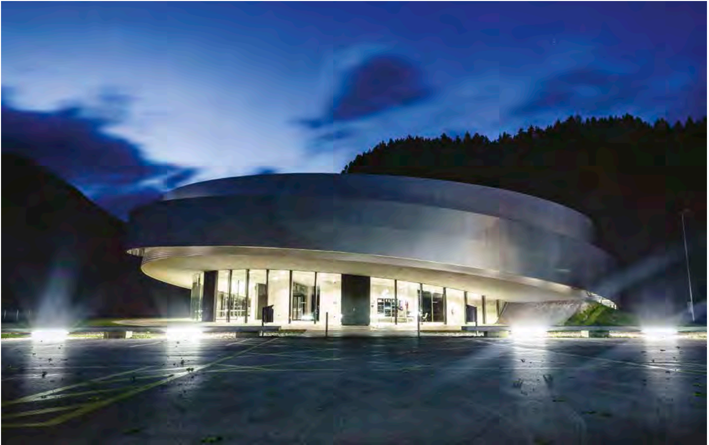
KSEVT, Centre Culturel pour les Technologies Spatiales Européennes, Vitanje, Slovénie.

la chorégraphie de la prochaine représentation, il répond : « Ce qui se passera en 2025, personne ne le sait vraiment. Nous n'essayons pas de faire de prédiction. Nous ne faisons tout simplement pas cela. En 2015, nous étions parvenus à construire le KSEVT. Mais en 2015, nous avions déjà perdu le KSEVT. Il est donc difficile de prédire ce qui se passera en 2025. Nous sommes actuellement essentiellement concentrés sur la recherche et le développement, pas sur l'infrastructure, le théâtre en tant qu'espace, mais véritablement sur l'acteur. 11 »