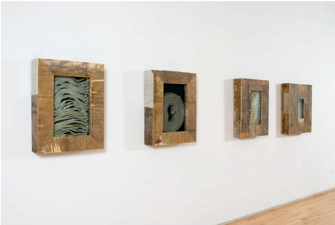
Theaster Gates, Love Seat , 2011. Theaster Gates, An Epitaph for Civil Rights and Other Domesticated Structures , 2011.