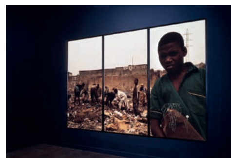
← Curatorial Activism. Towards an Ethics of Curating , couverture, 2018.