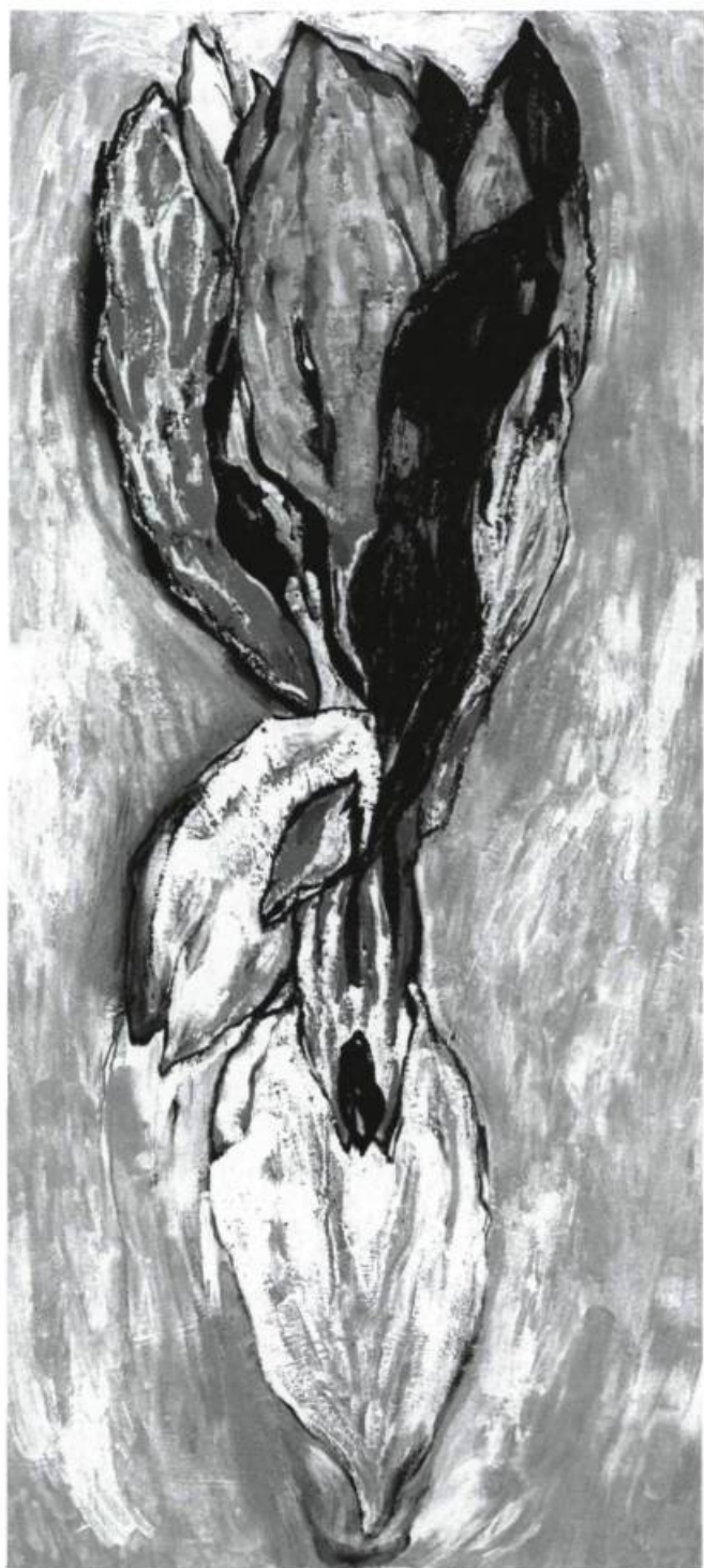
Irene F. Whittome, Gratitude , 1988. Huile sur bois ; 24 cm x 122 cm.

Une structure d'association végétale, mais aussi d'ordre physique et psychologique était récurrente dans cette exposition. C'était celle de l'étranglement, l'image du sablier conviendrait peut-être mieux à traduire cette forme que l'on retrouve par exemple dans Gratitude (1988). Le thème du passage est depuis plusieurs années exploité dans sa production comme le signalait Sandra Paikowsky dans son texte, The gift , publié dans le catalogue de l'exposition. Ce rétrécissement d'une forme épanouie, comme au travers d'un étroit