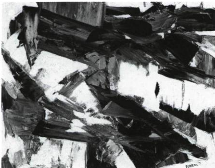
Marcelle Ferron, Sans titre , 1962. Huile sur toile ; 88 cm x 114 cm.