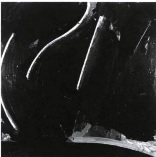
Pierre Blanchette, Peinture no 3 , 1990 ; 150 cm x 150 cm.