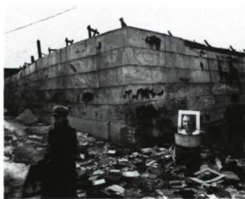
Mark Lewis, Let Everything be Temporary , 1991 ; 213 cm x 182 cm.

montrant une hybridité de l'image où le faire-apparaître-réel n'est pas le seul alibi dans la formation d'une structure visuelle. Les objets autour desquels on tourne et retourne sont formellement simples. Posés à même le sol en aplats ou en équilibre précaire, ils opposent statisme et mouvement d'où ressortent les effets de gravité, de poids, de volume, de tension. Les trois sculptures avec socles, parties intégrantes des œuvres ne prenant pas le rôle de démonstrateurs, participent également à la dynamique et à la cohésion interne de l'exposition dans une complicité unissant les sculptures entre elles. La matière, les dimensions et les formes structurelles à l'intérieur d'une mouvance des volumes imposent un écran au réel modélisé par l'imaginaire. Les multiples jeux d'échelles de ces feuilles augmentent notre désir d'en voir de plus en plus monumentales.