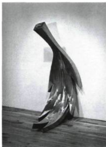
Jean-Pierre Morin, Sans titre , 1991 ; 52,2 cm x 137,7 cm x 63,7 cm.

Ces objets de formes archétypales démontrent un certain rationalisme car le matériau de base et les structures servent à définir les problématiques et les sensations dues à ces mêmes objets. Le