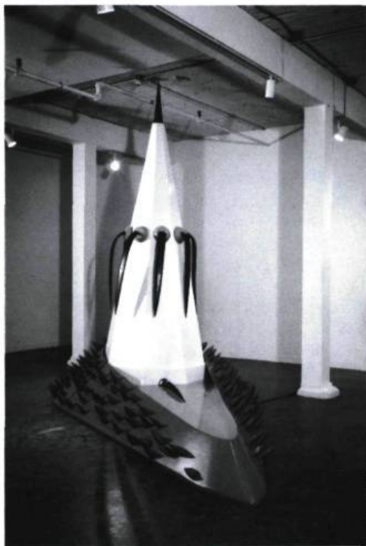
Denis Rousseau, Le plaisir , 1991. Bois peint, résine, eau et caoutchouc ; 3,3 x 2,3 m.

Bien que singulier, ce sentiment demeure néanmoins familier. Ses composantes évoquent des ques-