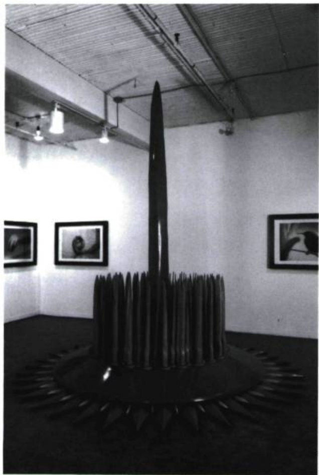
Denis Rousseau, Le désir , 1991. Bois peint, résine, métal, circuit électrique et bande sonore ; 3,3 x 2,3 m de diamètre.