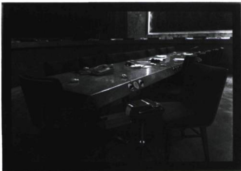
Claude-Philippe Benoît, Sans titre # 1 , 1992. Épreuve argentique ; 138 x 196 cm. Galerie Brenda Wallace, Montréal.

Claude-Philippe Benoît, galerie Brenda Wallace, Montréal. Du 18 janvier au 22 février 1992