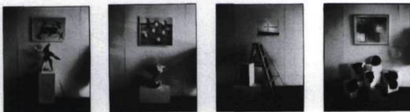
Serge Tousignant, Nature morte aux oeuvres d'art , 1986. Tirages Ektacolor. Collection Musée canadien de la photographie contemporaine.

Serge Tousignant, Parcours photographique , Musée canadien de la photographie contemporaine, Ottawa. Du 19 juin au 13 septembre 1992