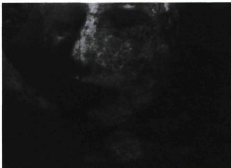
France Choinière, Projection 1 , de 24 images muettes de la seconde dernière, 1991.

En dehors de soi, jeunes photographes 1992, Galerie Dazibao, Montréal.