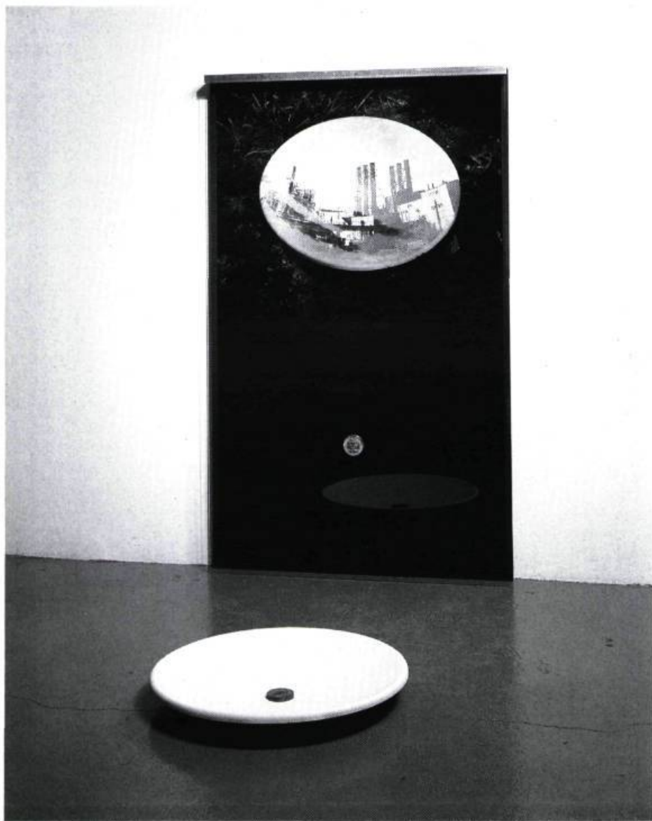
Denis Farley, Point référentiel n° 691040 , (Usine de pigments, Varennes, Québec), 1993. Photographie en couleur et matériaux mixtes; 153 x 96 x 6 cm.

Terra incognita , Expression, Saint-Hyacinthe; La galerie d'art du collège Édouard-Montpetit, Longueuil; Musée Marsil, Longueuil. Du 19 septembre au 21 novembre 1993