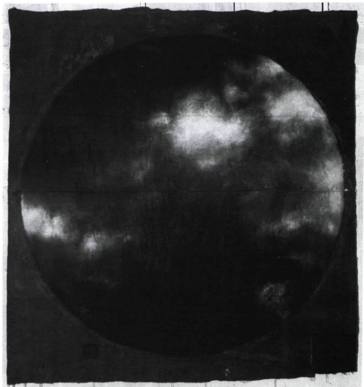
Alain Poirment, Around Moon , 1984. Acrylique sur toile de lin; env. 340 x 310 cm.

sont sculptées ? Différente plutôt lorsque Mihalcean se sert du matériau ni pour ses propriétés propres ni envers ce qu'il symbolise directement ? Qu'en est-il conséquemment de La minute de vérité (1992) de Dion et de Schnee quand les images d'une minute transmises par le Walkman video passent du plus ou moins indéterminé, les mouvements rapides et réguliers des vagues, jusqu'à un sentier dans une forêt, peut-être tropicale, et au bout duquel se détache en fondu une main où se balancent deux petites sphères rappelant l'animus et l'anima, le yin et le yang ?