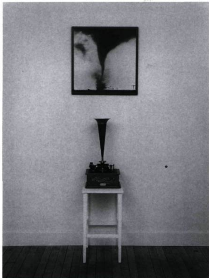
Raymond Gervais, Dans le cylindre , 1994. Collection : Prêt d'œuvres d'art, Musée du Québec.

Une exposition qui pose un regard ironique et provocateur sur la société moderne, nos habitudes de consommation et les valeurs qui s'y rattachent.