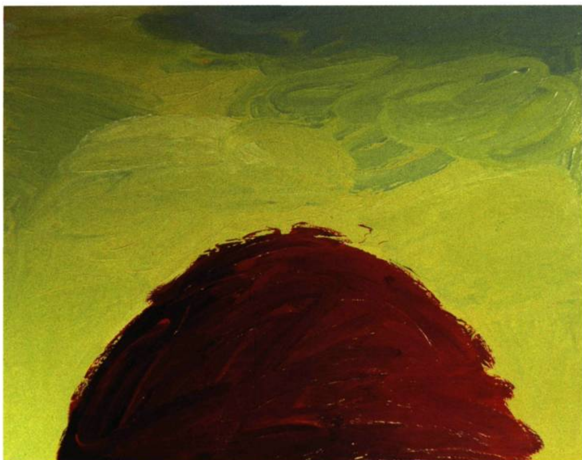
Christiane Ainsley, Le feu sacré , 1999. Acrylique sur toile; 122 x 130 cm.