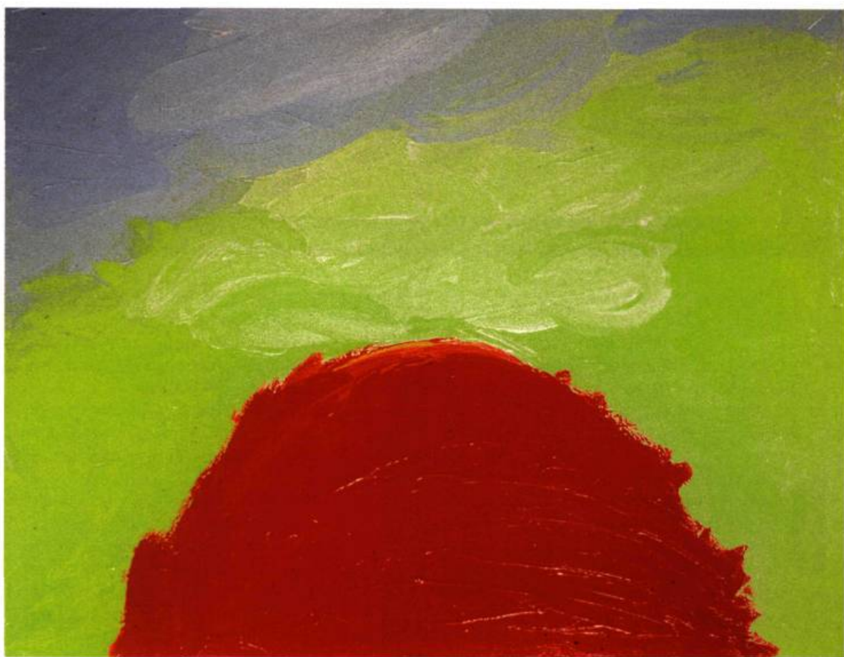
Christiane Ainsley, Alléinia , 1999. Acrylique sur toile; 122 x 130 cm.