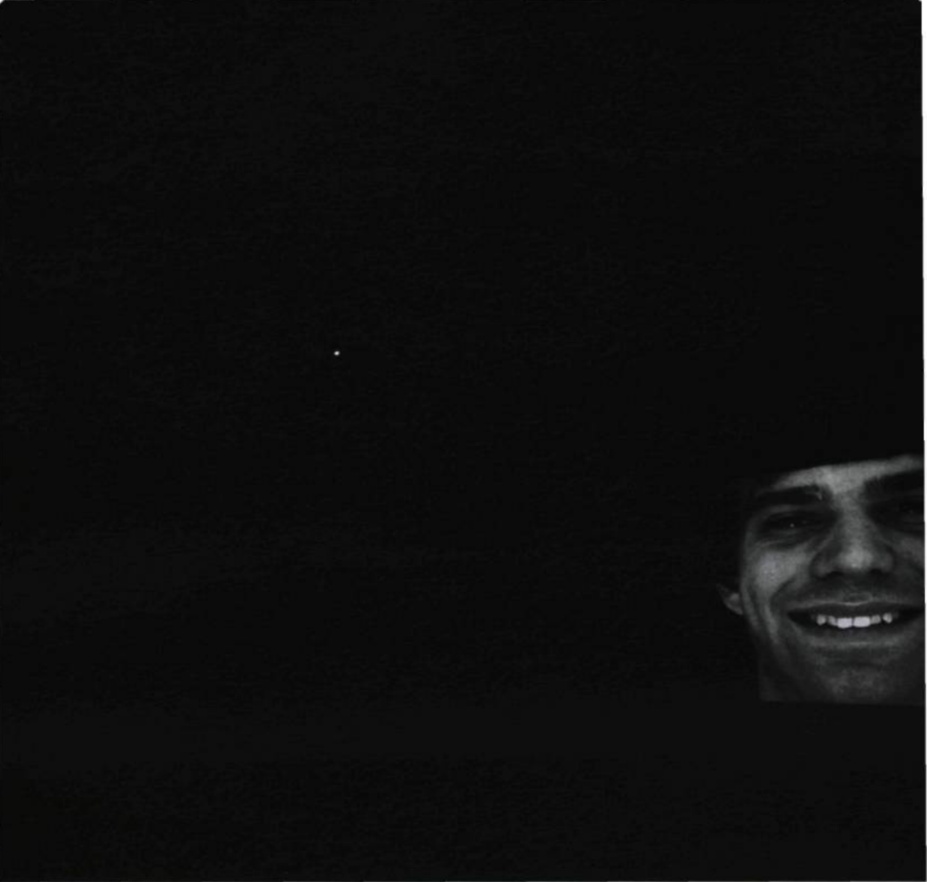
David Blatherwick, En pensant à toi , 2003. Installation vidéo. Collection de l'artiste.

teurs, l'espace que traverse cette adresse rieuse, on peut en déduire que c'est aussi à nous qu'ils adressent cette figure amène. On a même peine à ne pas leur répondre, en adoptant pareille attitude, répondant à leur invitation.