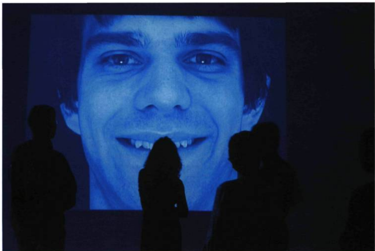
David Blatherwick, En pensant à toi (détail), 2003. Installation vidéo. Collection de l'artiste.