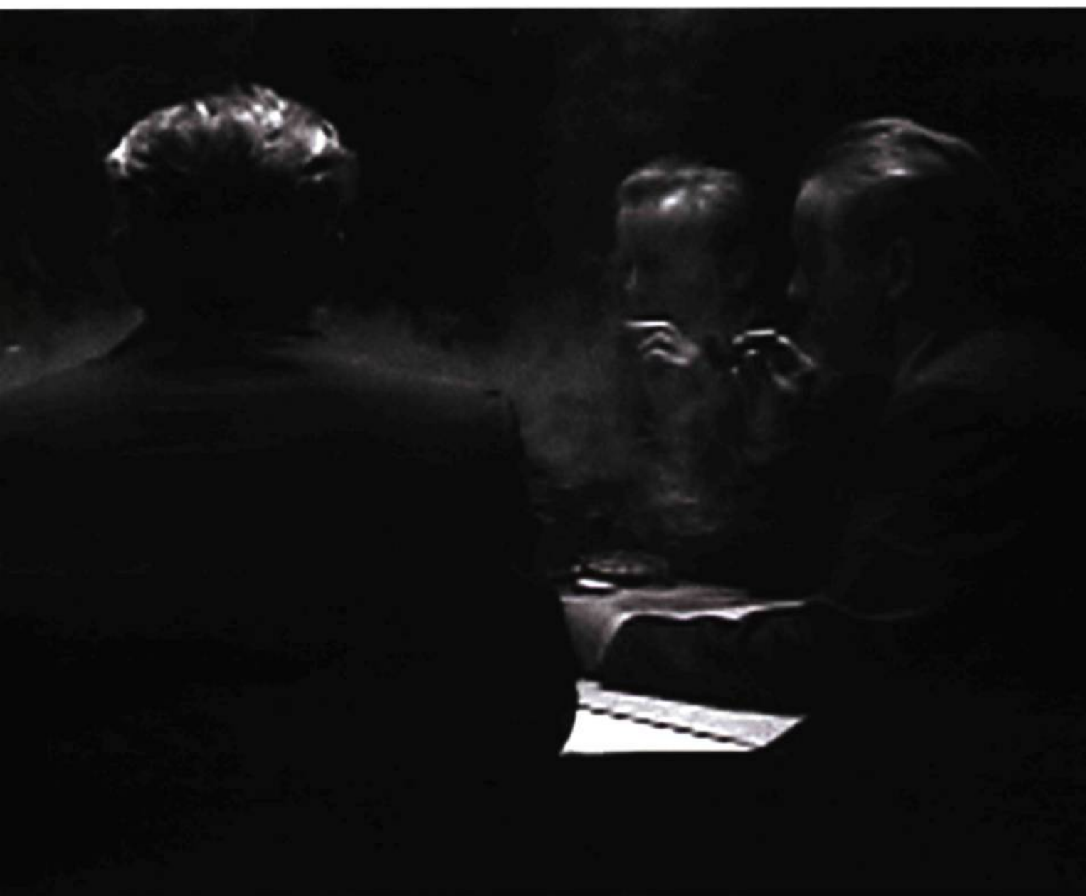
Daniel Olson, Take Five , 2004. Projection vidéo (noir et blanc, son stéréo, 23 minutes). Édition de 5 (plus 1 épreuve d'artiste).

création à l'inscrivant dans un mouvement infini de reproduction. Avec Take Five , Olson répond à sa manière à un désir de filiation. Une filiation qui repose sur une relation duelle et féconde avec l'identique. Cette vidéo n'est donc pas unique dans sa production. Avec Olson-Welles (2006), il va associer son visage à celui du cinéaste Orson Welles. Lors d'un enregistrement en direct, qui relève de la performance, Olson cherche à confondre son visage à une projection de l'image du réalisateur. Ce procédé, où le visage de l'artiste s'identifie à une photographie, se produira également dans deux autres vidéos. Dans Charles Wilbert (2003), c'est l'image du père qui sera son modèle et, dans Oh Danny Boy (2004), ce sera la photo d'Olson lui-même, alors qu'il était adolescent. Si ces diverses tentatives de substitution visent une certaine ressemblance, celle-ci ne renvoie pas à une dépendance à l'égard de ses modèles. Il n'est certes pas question de comparer une image à l'original, mais de donner vie à l'image du double comme altérité