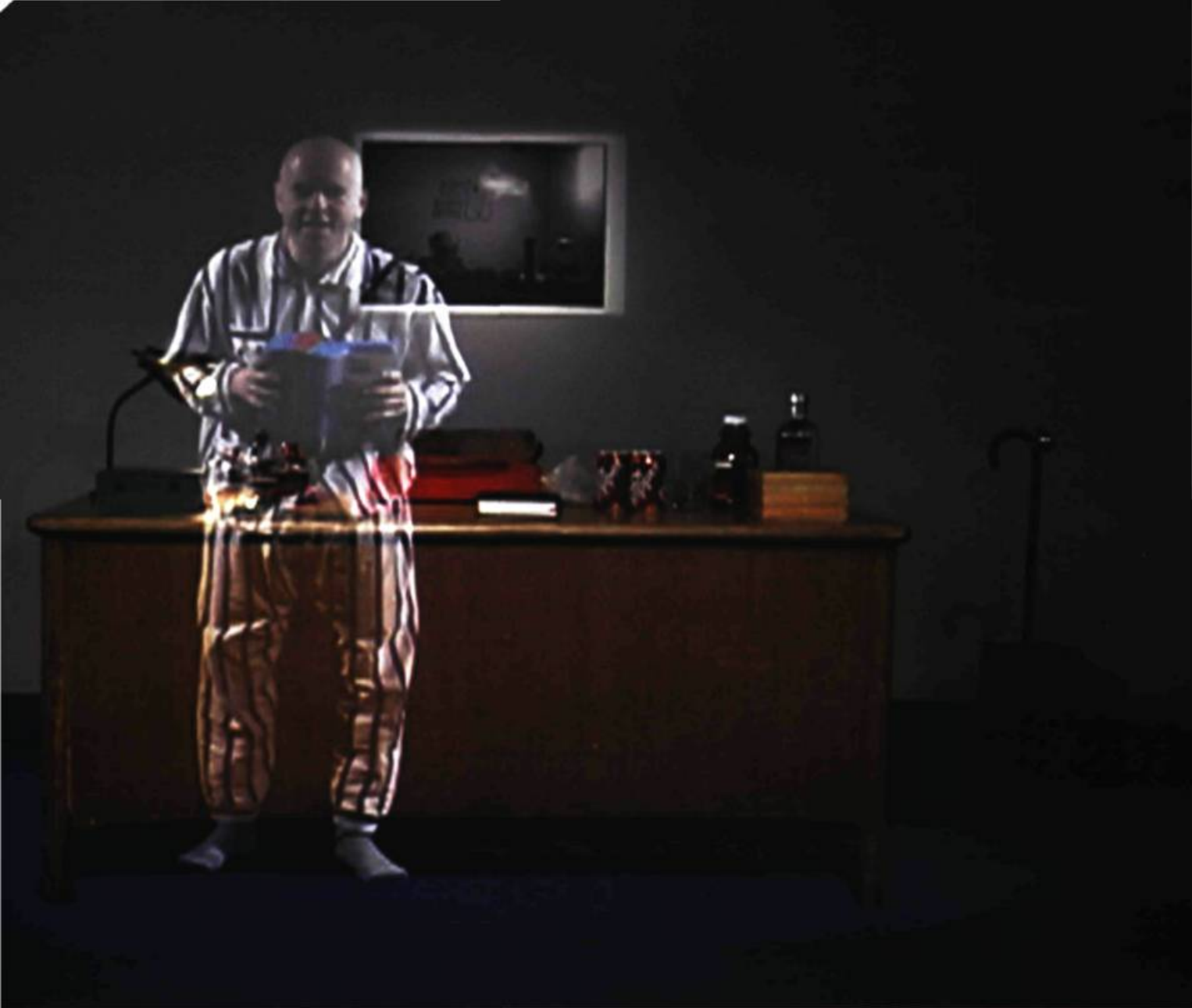
Daniel Olson, Pepper's Ghost , 2003. Vidéo [couleur, son stéréo, 16 minutes], Édition de 5 (plus 1 épreuve d'artiste).