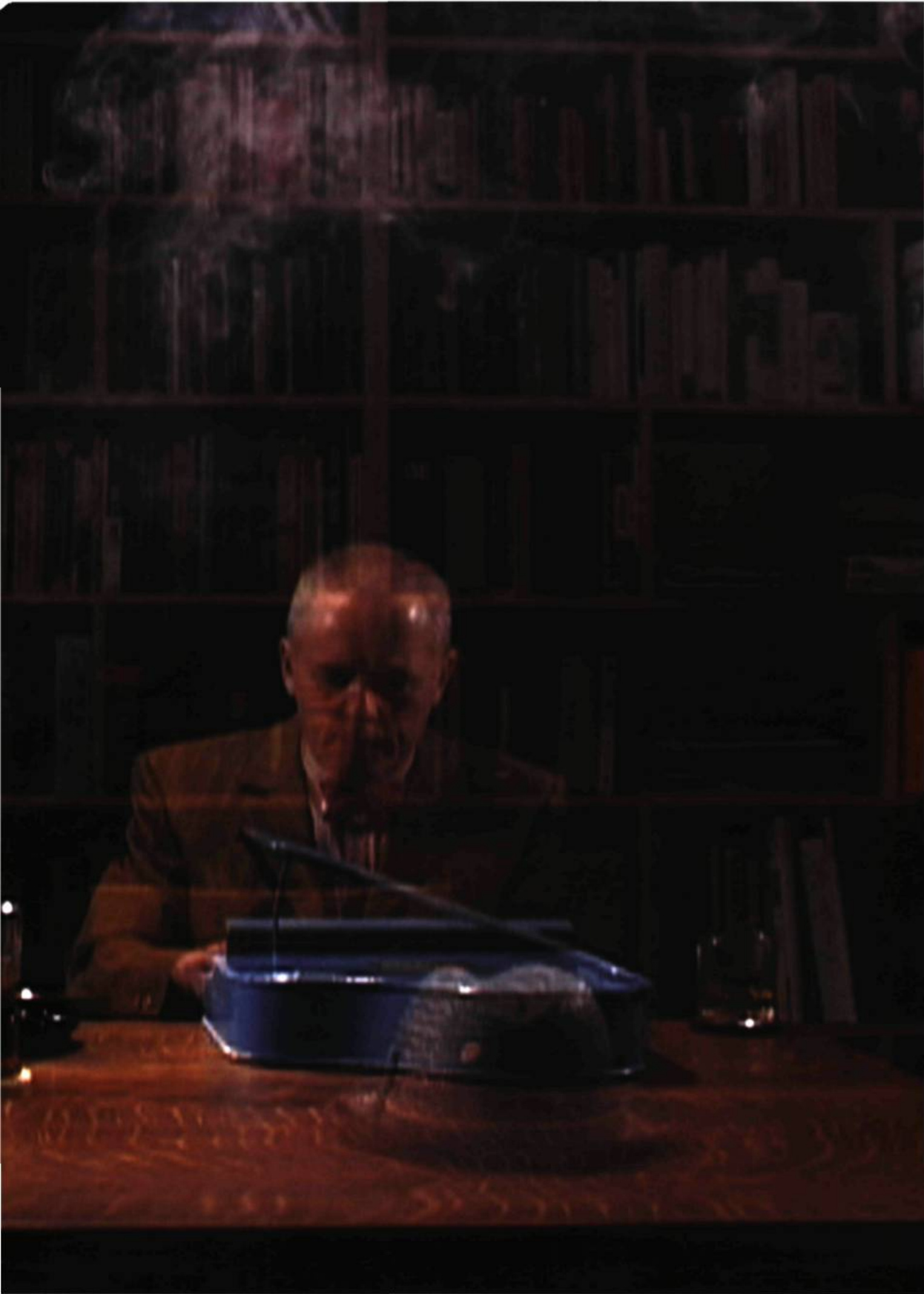
Daniel Olson, Beside Myself , 2006. Projection vidéo [couleur, son stéréo, 54 minutes]. Édition de 5 [plus 1 épreuve d'artiste].