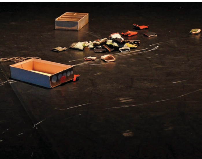
Vida Simon, Quatorze miniatures , 2010. Performance.