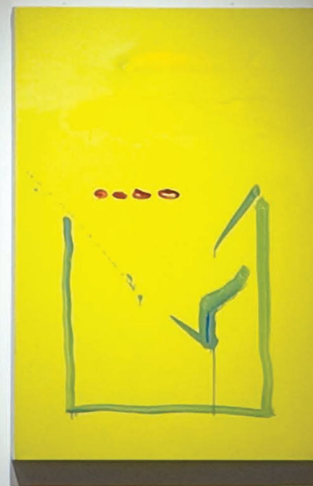
Robert Houle, Alzarin Parfleche, Fetish, Shaman et Lightbox , 2011. huile sur toile; 91 x 61 cm (x 4).

verte se démarque. Démonstration de la solitude ou énonciation de la différence, elle semble participer à l'expression d'une « métaphore de la condition existentielle de l'humanité 8 ».