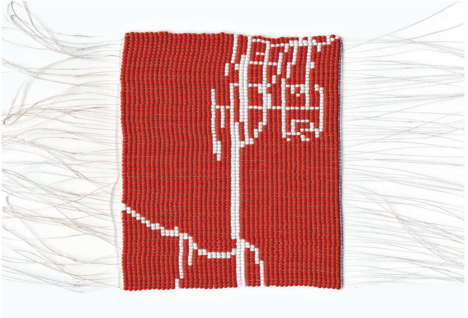
Nadia Myre, A Study of Ownership Use and Territory in Relation to Article 19 of the Indian Act: Surrendered Lots 1, 2, 3 and 4 , 2009. Perles de rocaïlle, fil; 30 x 38 cm.