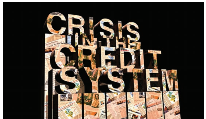
Melanie Gilligan, Crisis in the Credit System , 2008.