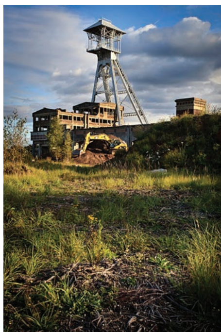
Site de la Manifesta 9, à Genk, Belgique.

Par conséquent, la Manifesta représente l'archétype par excellence de la biennale d'art contemporain telle qu'elle s'est imposée dans la deuxième